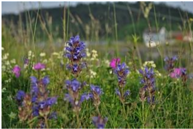
Dragehode i blomst på Gressholmen.