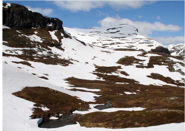
Villmarkspreget inngrepsfritt område med Sovarenuten i midten.

Disse stortingsmeldingene understreker den verdien urørte naturområder representerer i seg selv og for andre tema, herunder friluftsliv og naturmangfold. Et problem er at hva som er "urørt natur" alltid vil være subjektivt. For noen er det nok å komme seg vekk i fra selve bykjernen, andre opplever urørt natur først når de sitter med en opplevelse av at det er langt til nærmeste menneskelige inngrep. Skal man klare å følge opp de politiske målsetninger om å ivareta restene av det som oppleves som urørt natur og hensynet til arter som har behov for store urørte områder, blir det nødvendig å konkretisere begrepet på en kvantitativ og målbar måte. Det er her INON kommer inn som en helt nødvendig operasjonalisering av begrepet "urørt natur" slik at man i forvaltningen kan følge opp de tidligere nevnte målsetningene.