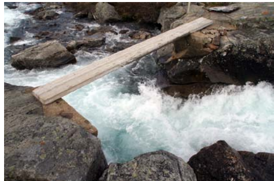
Det er på mange måter et tett forhold mellom vassdragsnaturen og muligheten foret verdifullt friluftsliv. Her i fra Hardangervidda.

# En bør vis varsemnd med å gi løyve til utbygging langs mye brukte DNT ruter.