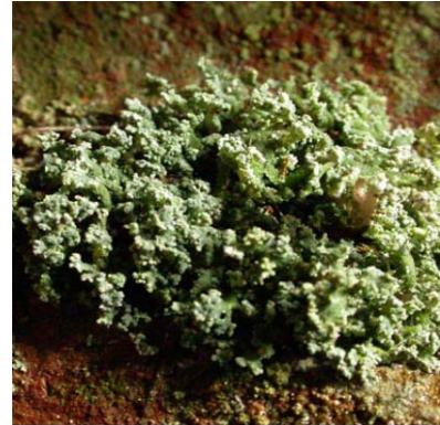
Flatsaltlav vokser på steiner i og langs fosser og stryk. Denne lavarten er kategorisert som "sårbar" pga. at mange forekomster er utsatt for kraftutbygginger i elver og bekker. Den ble i 2006 lokalisert i Stølselvi i Granvin

Videre bør det inn et punkt hvor man ikkje gir løyve før tilstrekkelig utredning er gjort. NVH har tidligere sett eksempler på det motsatte der HF går inn for et kraftverk samtidig som man påpeker at en utredning er mangelfull.