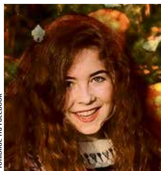
Profilbilde fra Facebook

– Fordi naturens verdi ikke kan måles i penger.