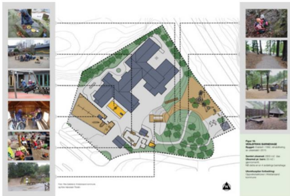
Figur 14 Veslefrikk barnehage i Kristiansand. Et eksempel på tilrettelegging for alle.

jentene liker å være. De er blitt tøffere av det, slik lederen ser det. Flate partier er egnet for trehjuls sykling og inneholder i tillegg store sandbassenger med lekebåter, lekehus, lekekomfyr, husker av ulike slag, opplegg for vannlek osv. Mange tiltak er utformet slik at de er tilgjengelige for alle, f.eks. opphøyde sandkasser, lekehus med ramper, og den forannevnte stien er anlagt slik at rullestolbrukere kan dra seg rundt hele skogsområdet. Ifølge enhetslederen var det før ombygging mange unødvendige hindre både for små barn og rullestolbrukere, f.eks. rundstokker og kanter. I dag er det mye å gjøre for alle grupper. Opplegget med små boder, bord osv. bidrar til at de med en funksjonshemming kan gjøre mer ute, og dette har ført til bedre integrering av barna.