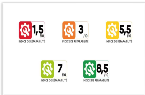
I Frankrike må telefoner merkes med hvor enkelt det er å få dem reparert.