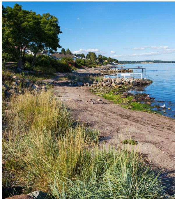
Illustrasjonsfoto som ikke avbilder omtalte saker..

Den tredje sporet, som vi klart tar til orde for, er å innføre en nasjonal natur- og miljøklagenemd , etter dansk eller svensk modell, for å sikre at intensjonene med pbl (2008), naturmangfoldloven og jordloven ivaretas.