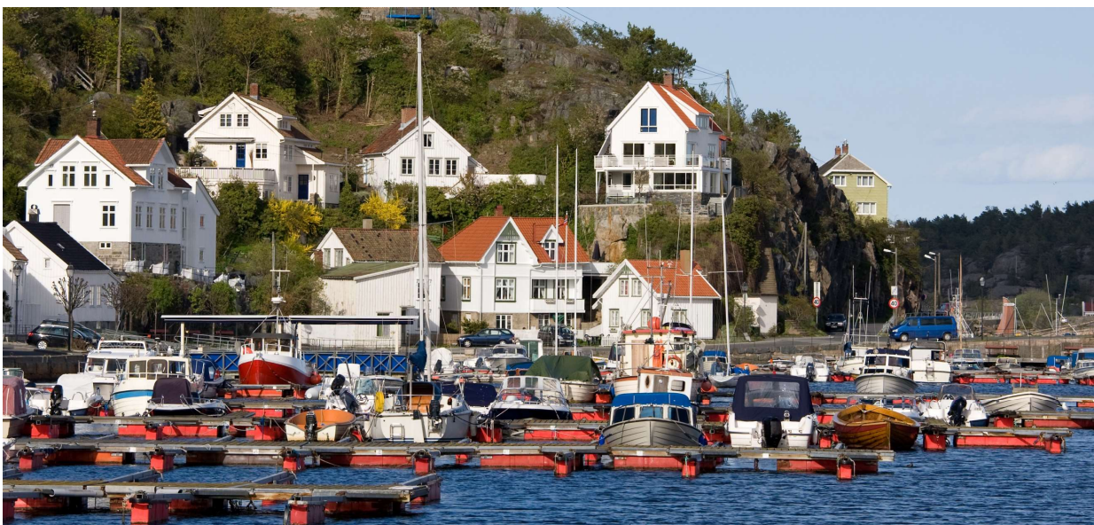
Illustrasjonsfoto som ikke avbilder omtalte saker.