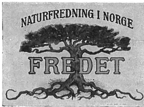
Fredningsmerke i henhold til lovenes § 5.