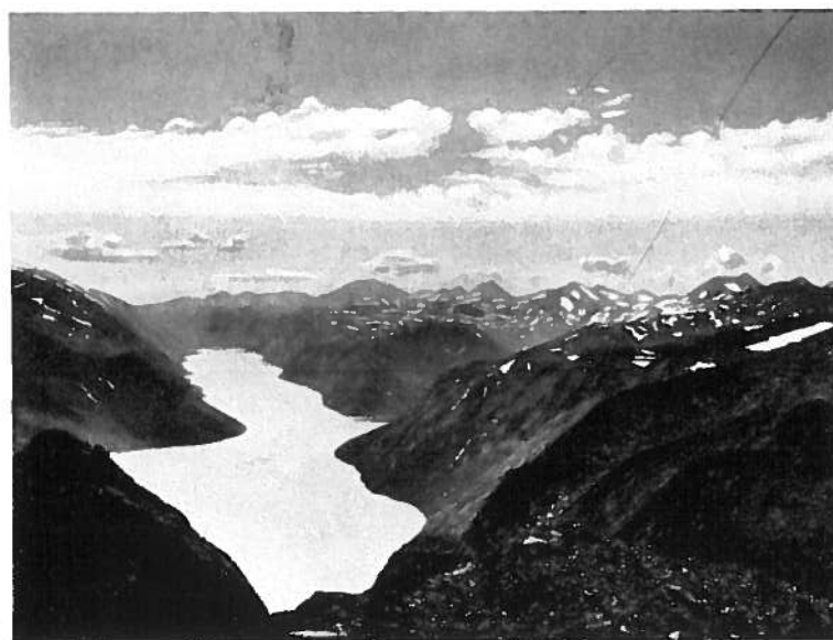
Gjende fra overste kammen av Besseggen.

Å R S B E R E T N I N G 1 9 3 8 - 1 9 4 0