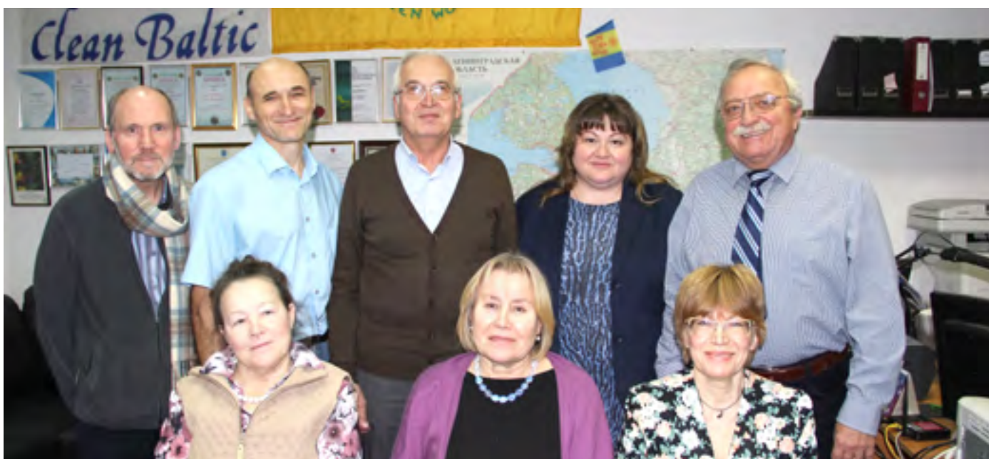
Инициаторы создания новой общественной организации

Таким образом, 3 из 4 российских НКО, участников сети Декомиссия, не могут продолжать работать в прежнем статусе, и вынуждены искать новые формы работы для обеспечения своих конституционных прав на безопасную окружающую среду и продвижения безопасного вывода из эксплуатации АЭС.