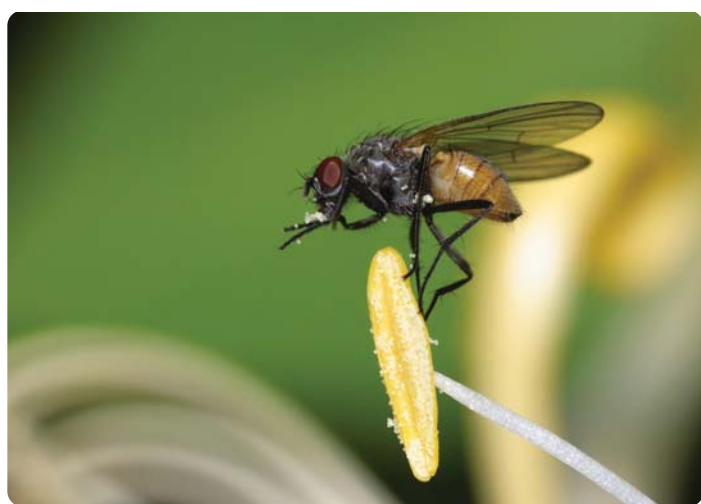
TOVINGET FLUE.