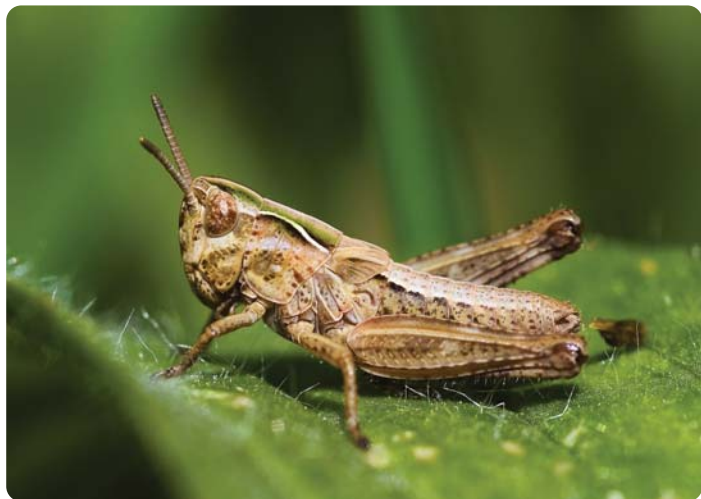
GRASHOPPE.