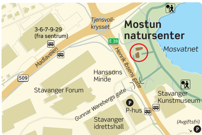
KART: ELLEN JEPSON

Søndag 2. desember: Juleverksted . Friluftshuset Orre 12–15. Arr: Besøkssenter våtmark Jæren.