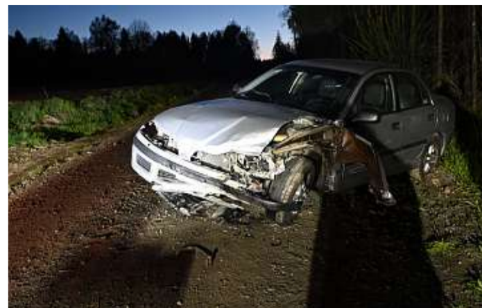
ULYKKE: Fem personer var involvert i ulykken på Blekstadvegen.