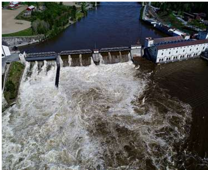
RÅNÅSFOSS: Rånåsfoss og Akershus Energi er en del av Nes kommune etter grensejusteringen. Nå satser selskapet på storskala vindkraft.

Det er ventet at Sivilombudsmannen kommer med sin dom i den saken innen sommerferien.