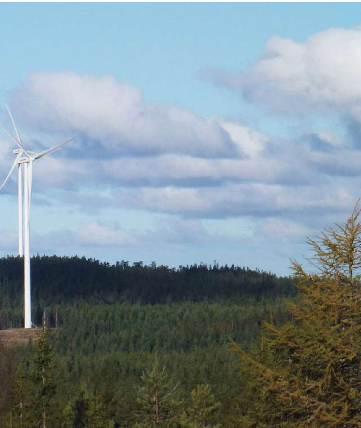
på Nes-grensa i nord tidligere denne uka. (Arkivbilde)