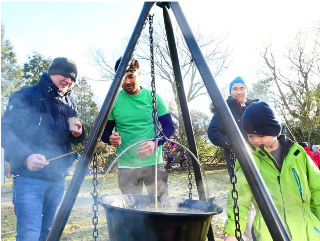
Afghansk suppe under verdens våtmarksdag

Resultat: Ved 20 arrangementer er det sendt invitasjon og registrert deltagelse fra målgruppen. Det omfatter 7 foredrag, 3 matarrangement, markering av verdens våtmarksdag, fuglekasseverksted, humlekasseverksted, trekkfugldag x 2 (Kvasheim), 3 klesbyttearrangement/barnas byttedag, reparasjonskafe, samt familiedag om humler (Orre).