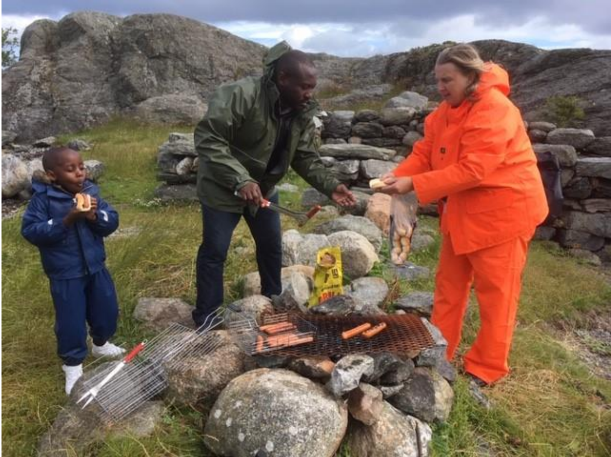
Pølsegrilling i regnet på Marøy

Resultat: Det er gjennomført en dag med mini-ferie til Marøy. Pga. surt vær var vi 13 som dro ut, mot 44 som var påmeldt.