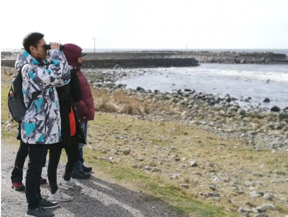
Trekkfugldag på Kvasheim