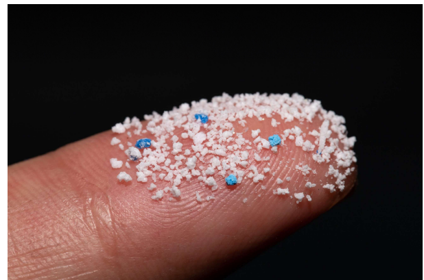
Mikroplast ender opp i vann og jord. Noe er produsert som mikroplast, resten brytes ned til disse små partiklene.

Miljødirektoratets liste over prioritert miljøgifter og andre stoffer må legges til grunn for forbud. Det haster mest å forby bromerte flammehemmere, klorparafiner, fluorerte miljøgifter (PFAS) og fosfororganiske stoffer.