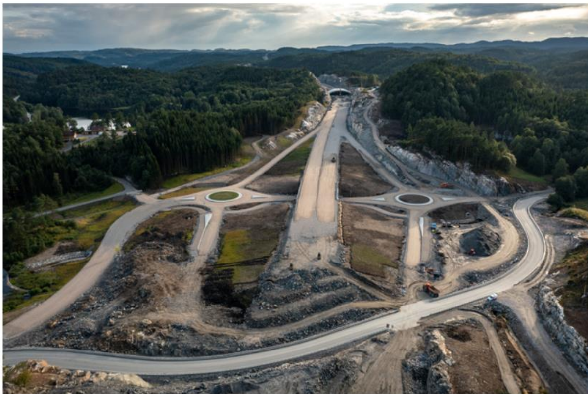
TA VARE PÅ DE VEIENE VI HAR