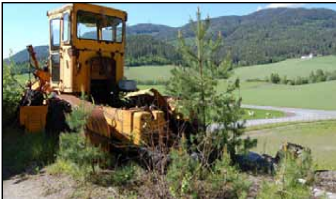
Ulovelig søppeldeponi