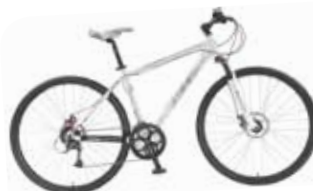
Sykkelen gis i gave av Naturvernforbundets samarbeidspartner WaterCircles forsikring

Den av dere som verver flest medlemmer under landsmøtet har størst sjanse til å vinne en sykkel i trekningen vi gjør på søndag.