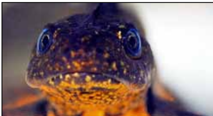
”Min nabo er en drage” (Foto: Rudolf Nilsen)