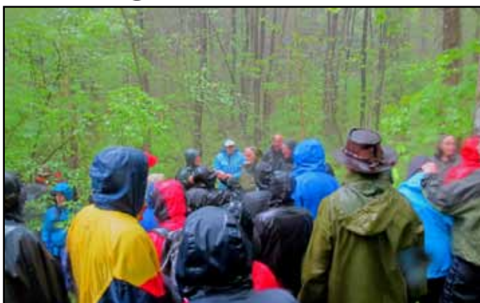
Nedre Timenes