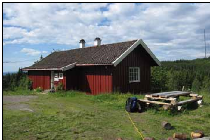
Frønsvollen sæter

Den viktigste politiske saken NOA behandler for tiden er uttalelser til det statlige pålagte og statlige ledet planarbeid for en plan for areal og transport for de to fylker.