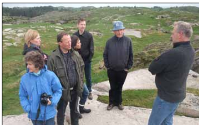
Fylkesstyre i Rogaland

For tiden arbeider vi for å få tak i nye lokaler sammen med andre grønne organisasjoner. Bygningen det kan være snakk om ligger ved Mosvannet, et av de mest fulgerike turområdene i Stavanger. Dersom vi får en avtale med Stavanger kommune om Mostunet ønsker vi, i tillegg til å få nytt kontor, å lage et naturinformasjonssenter som til å begynne med skal være åpent for publikum hver søndag.