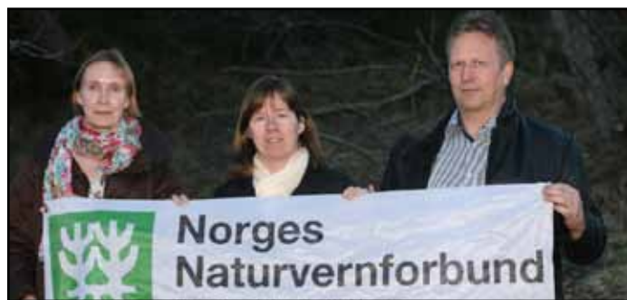
Nytt lokallag i Averøy og Kristiansund

Naturvernforbundet i Møre og Romsdal har auka aktivitetsnivået sitt jamnt og trutt dei siste åra. Fylkeslaget har forsøkt på få på beina nye lokallag, sist med oppstart av lokallag i Kristiansund / Averøy. Dei siste åra har det vore mykje fokus på energisituasjonen i Midt-Noreg, men den siste tida har det blitt meir fokus på naturmangfold, både registrering av og bevaring av naturverdiar og registrering av uønska artar.