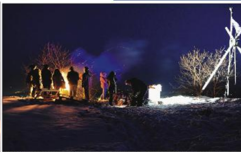
Lørdag lykte en varde opp Møkkølen med en klar beskjed: – Stopp oljeboring! Folkeaksjonen opplytt i Lofoten, Vestvågen og Senja og Natur og Ungdom vil bli trykket oppmerksomhet som mulig.

Publisert 21.02.2011 kl 09:05 Oppdatert 21.02.2011 kl 09:09