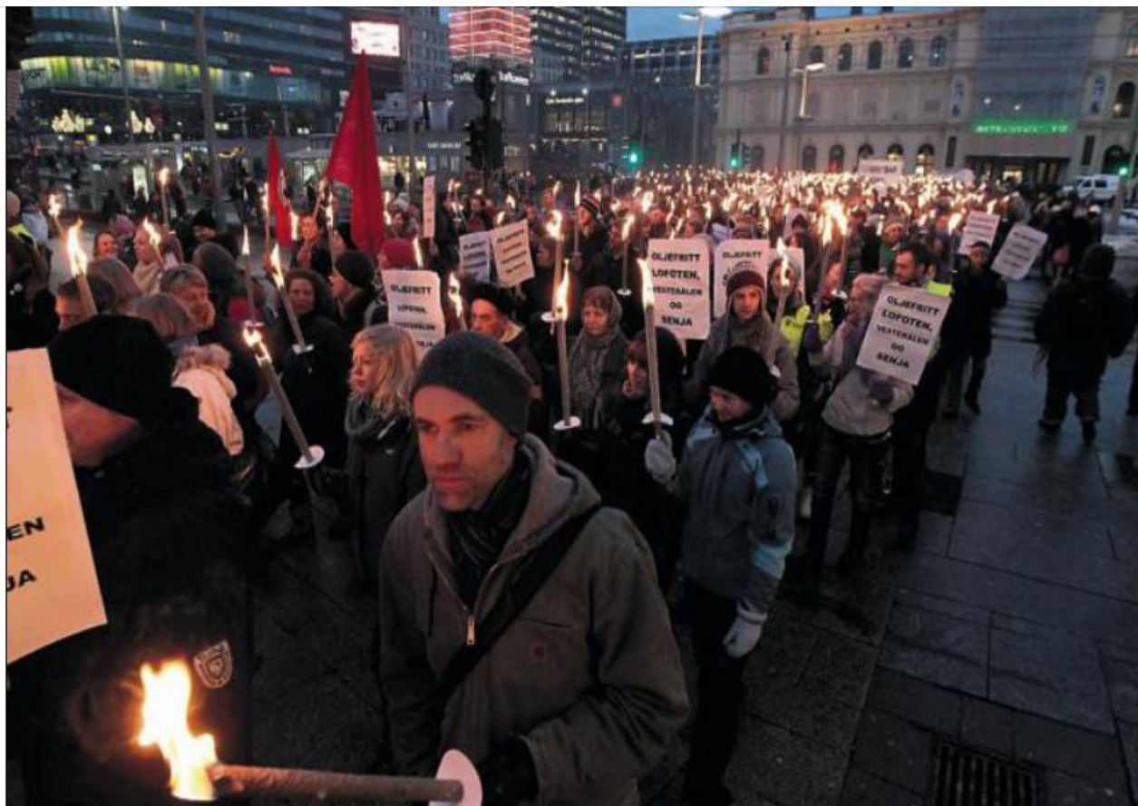
KJEMPER MOT OLJE: Folkeaksjonen oljeboring i Lofoten, Vesterålen og Senja gikk i fakkeltog i går for å vise fram oljemotstanden.