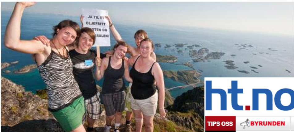
Natur og Ungdom avholdt sin sommerleir i Lofoten i 2009. I 2010 inntar Naturvern miljøfestival. Ja til et oljefritt Lofoten vil utvilsomt stå høyt på agendaen.