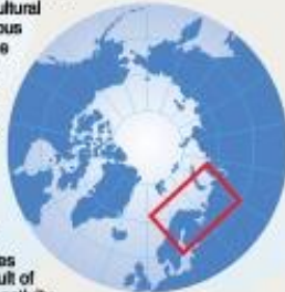
Part of each level of impact by country

The GLOBIO project, global methodology for mapping human impacts on the biosphere, was initiated to provide policy makers with a tool to help assess the likelihood of environmental impacts on biodiversity and ecosystems resulting from human activity. The impact of infrastructure development on reindeer potentially threatens the cultural traditions of the Barents region indigenous people and their chosen way of life. The probability of impact on wildlife, vegetation and ecosystems is related to distance to different types of infrastructure. The distance zones of impact are lowest in forest and highest in open tundra. The extent of the zones are based upon several hundred field studies from international scientific journals. Impacts include reduced abundance of wildlife, reduced accessibility to important grazing habitat, and changes in predator-prey relationship as a result of infrastructure and associated human activity.