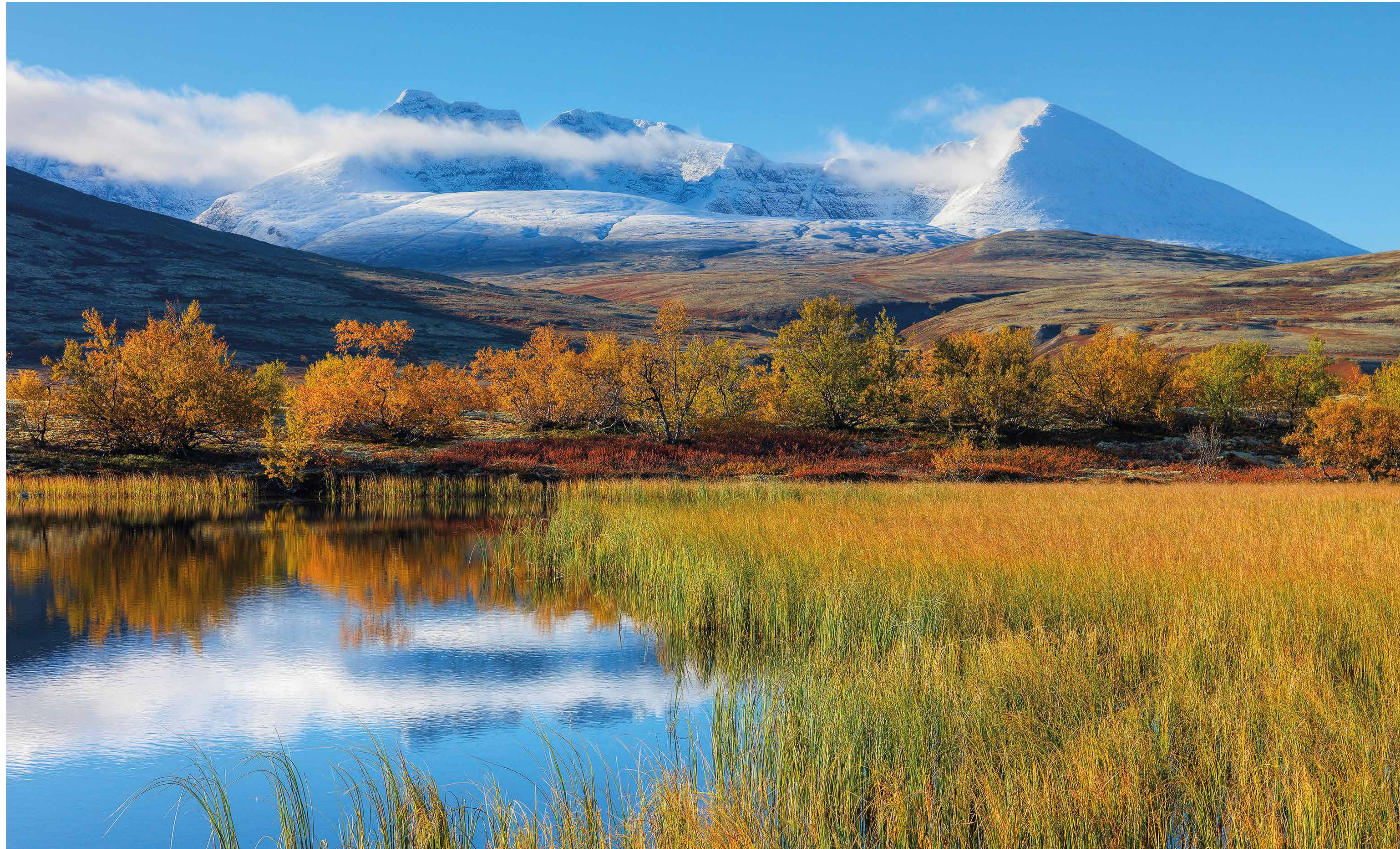
Døråldalen og fjell i Rondane nasjonalpark, Hedmark. I 1962 ble Rondane Norges første nasjonalpark. Det skjedde etter mange tiårs innsats for å få vernet et større sammenhengende naturområde. Nå passer vi på at det ikke gis tillatelser til veier og utbygging inne i landets nasjonalparker.