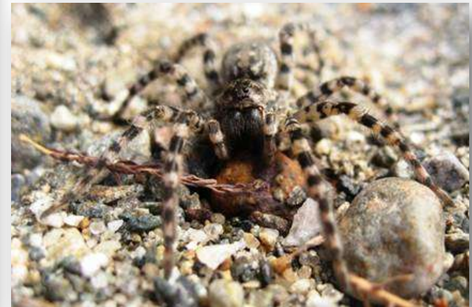
Edderkoppen Arctosa cinerea (EN)