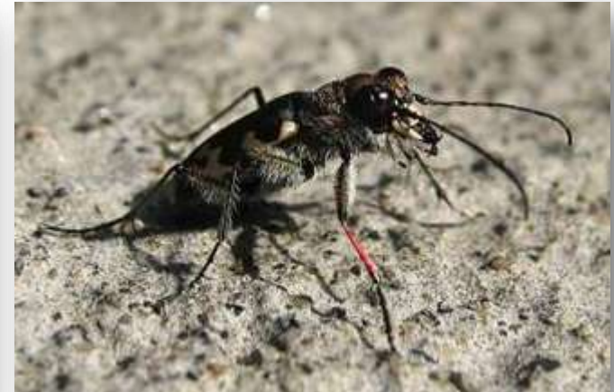
Elvesandjeger (EN; blir prioritert art)