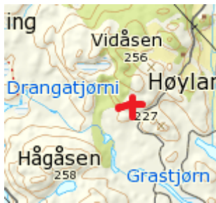
Figur 5. Artskart

Artskart er ei kjelde som må tolkast ved bruk. Som ein kan sjå på figur 5 så finnst det ikkje nokon registreringar direkte rundt omsøkte område. Spørsmålet er då om det ikkje finst artar i området, eller at det finst artar i området, men ein biolog har ikkje funne det verdt å registrere, eventuelt at det aldri er kartlagd. Så lenge ein ikkje veit noko om årsaka, har ein heilt klart vesentlege manglar i kunnskapsgrunnlaget. Vi vil t.d. ikkje heilt utelukke at det kan vere klokkesøte i området på figur 5. Kunnskapsgrunnlaget om artane er godt nok til å kunne avslå ein søknad, men ikkje godt nok til å gi løyve. For å kunne gi løyve til planting av sitkagran, er det dessutan krav om særleg nøye vurdering, og det gir ikkje kunnskapen frå Artskart grunnlag for i denne saka.