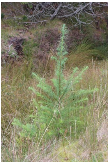
Figur 2. Hybridlerk spreidd frå plantefelt på Smøla.