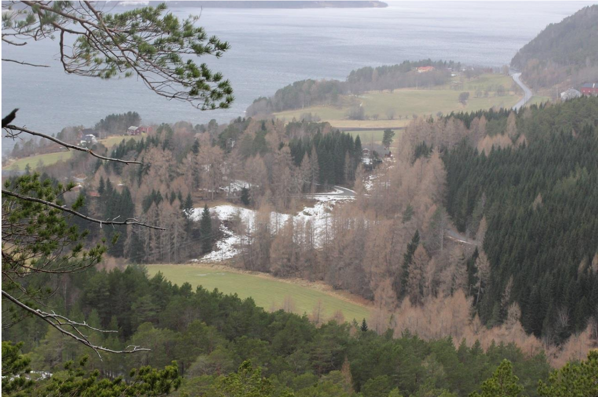
Figur 3. Frå Gyl i Tingvoll 10.2.2015. Europalerka på biletet har som opphav ei planta trerekke langs enga i framkant på biletet kring 1780. På eit tidspunkt var det ikkje noko særleg spreing til områda rundt, og etter kvart går dette over til å bli tilstrekkeleg spreing til at neste gong ein hogger eit bestand så kjem det omtrent berre europalerk opp igjen.