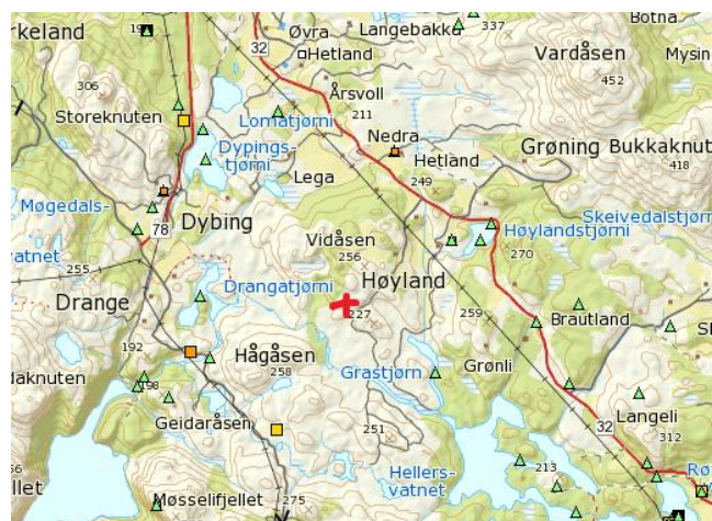
Figur 4. Artskart. Raud kross markerar omsøkte plantefelt.

Artskart er ein viktig del av kunnskapsgrunnlaget i Fylkesmannen sitt vedtak.