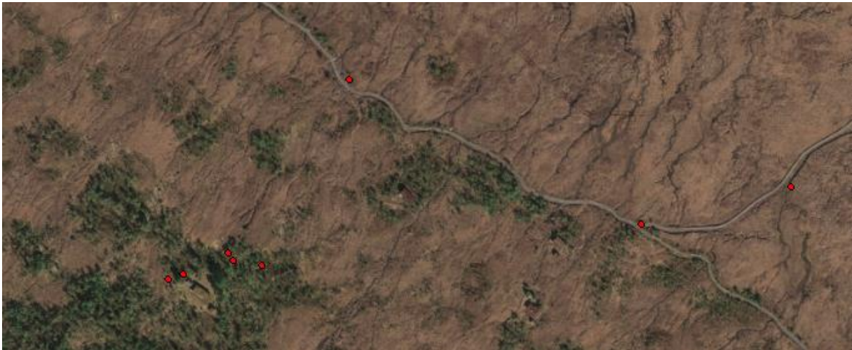
Figur 1. Frå Artskart. førekomst av hybridlerk, Rauma. Mortre er i området med fleire punkt samla. Funna er gjort tilfeldig, observert frå tur langs ein sti, så ein må rekne med mørketal.

Vi har sett nærare på eit område på Smøla der det blei planta hybridlerk for ein del år tilbake. Så snart trea er store nok, får dei konglar, og frøspreiinga er alt i gang. Vi har sett det same i Rauma kommune, der det også er tale om spreiging i alle fall over 450 meter.