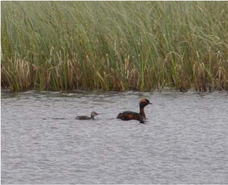
Horndykker med 1 unge (ca. 5-6 d.) 6.7.2012.