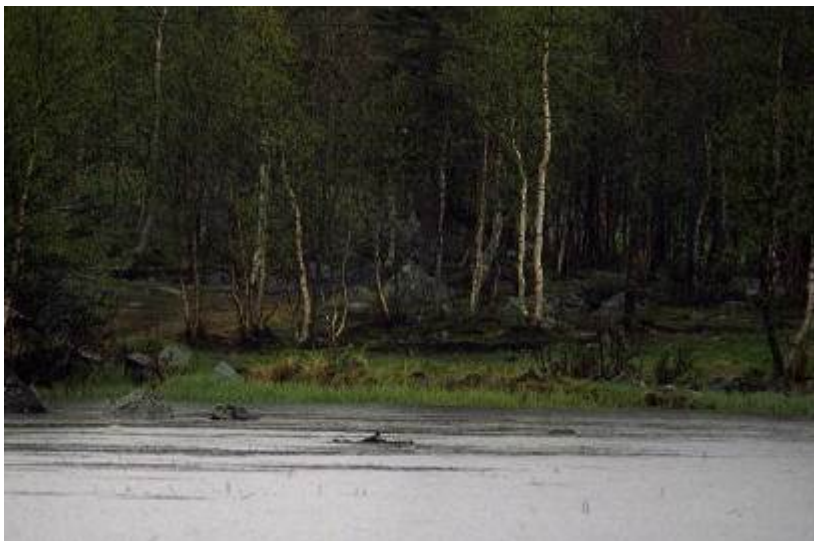
Horndykker på reir i Veslefjorden 1995.

1995: Hekking. Første hekkefunn i Buskerud i Veslefjorden (770 moh.) ved Geilo 4.6-17.7 (Stueflotten 2003). Et par bygget reir to ganger. Oppdaget 4.6 (reirbygging), 2 egg 8-14.6, forlatt 16.6. Nytt reir med 1 egg 19.6. Ruget 23.6, forlatt 17.7 (Lars Egil Furuseth mfl ). Potensielt hekkeområde. Ingen nye hekkefunn i senere år, men flere observasjoner av horndykker er gjort, også i Slåttehølen Ø for Veslefjorden (se nedenfor) og Ustedalsfjorden (se side 18).