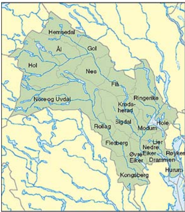
Figur 1: Buskerud fylke.

Da hekkeområdet til horndykker i Buskerud fylke ligger i øvre del av Hallingdal, vesentlig Hol, Ål og Gol kommuner ble kartleggingen konsentrert om tjern i disse områdene i 2012.