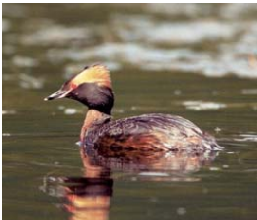
Figur 2. Horndykker (1 av 2 ind.) fotografert på vårtrekk i Eikredammen, Hemsedal 27.4.2012.

De første horndykkere ble registrert i Eikredammen, Hemsedal 27.4 , da 2 ind. ble observert (1 ind. fotografert, Figur 2 ). Tre ind. ble registrert 29.4. Ingen andre trekkobservasjoner ble gjort i lavereliggende vann i Hallingdal denne våren, selv om våren var kald og mange høyereliggende tjern var islagt til midten av mai. I nedre delen av Buskerud ankom horndykkeren i begynnelsen av april (6.4 Fiskumvannet/AO). Et overvintrende ind. ble registrert i Nordfjorden 11.1.2012 (AO). Første registrering på en hekkelokalitet var 4.6 i Gautetjern, Golsfjellet (AO). Dette kan skyldes en sen ankomst dette året og direkte ankomst til hekkeplassene fra lavereliggende områder av fylket (eller Oppland!).