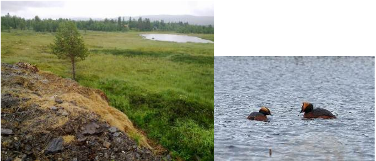
Horndykkerpar våren 2010.

Hekking 2010: sannsynligvis vellykket hekking. Dette er eneste kjente hekkefunn av horndykker i vannet.