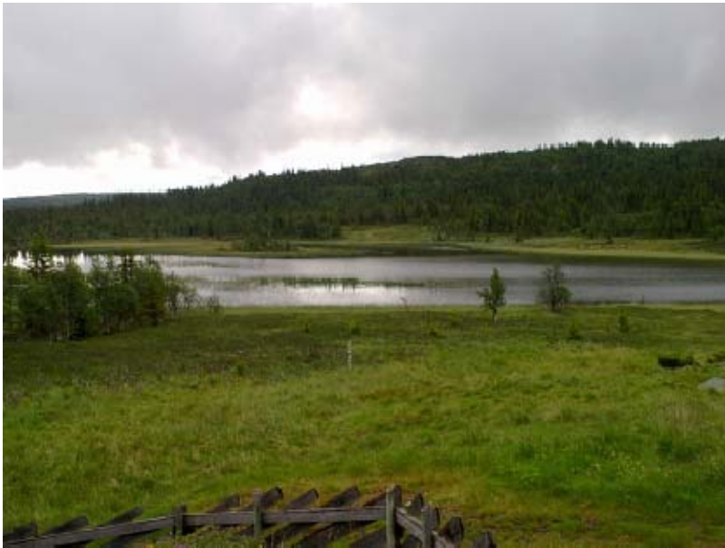
Torkjellsettjørne 12.7.2012 mot S.