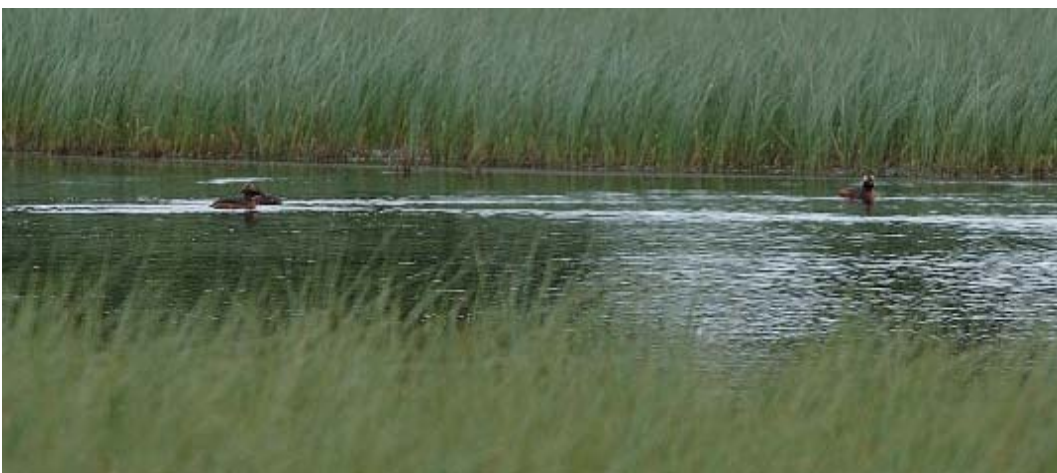
Tre horndykkere i Drammedalshølen 17.6.2007.