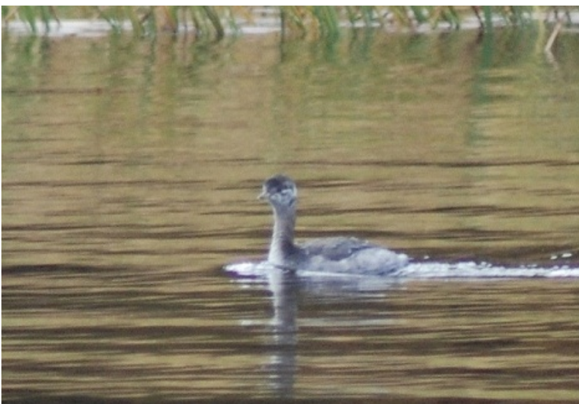
Horndykker 1K (ungfugl) i Ustedalsfjorden ved Geilo 26.09.12.

På høsttrekk er det bare registrert en horndykker i Hallingdal. En ungfugl (1K) ble observert i Ustedalsfjorden, Hol i perioden 26.9-10.10 2012 (Arild Gauteplass mfl. ). Fuglen spiste små fisk (ørekyte!) og fjær fra vannoverflaten! Bildet under viser også at ungfugler har noe av ungedrakten igjen og dette tyder på ungen er klekket sent sesongen (omlagt kull, kanskje klekket i nærområdet!).