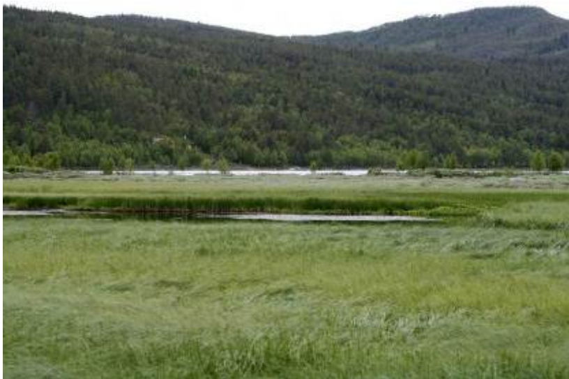
Fjellheim våtmarksområde, Vatsfjorden 20.6.2009.