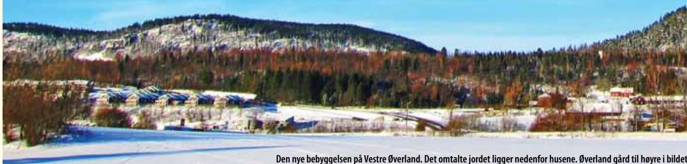
Den nye bebyggelsen på Vestre Øverland. Det omtalte jordet ligger nedenfor husene. Øverland gård til høyre i bildet.

Tekst: Finn Otto Kvillum