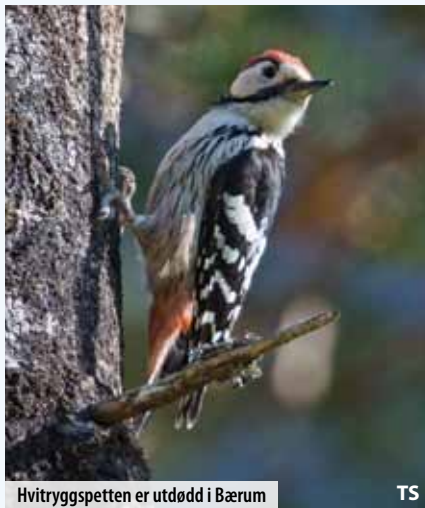
Hvitryggspetten er utdødd i Bærum

De rike løvskogene i lavlandet har minket i areal og blitt stadig mer fragmentert. Løvmeis er en karakterart for varmekjære løvskoger, og er fortsatt vanlig i Follo. Men i Bærum, såvel som Asker og Oslo, er arten på vei ut. Noen få par hekker fortsatt i Bærum, særlig ved Dælivann, men det går stadig lenger tid mellom hvert funn.