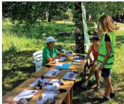
NiB var på pletten - Biomangfolddagen på Lilløyplassen naturhus 2.6.2018.

For nærmere detaljer om årsmøtet, se protokollen som står etter innkallingen.