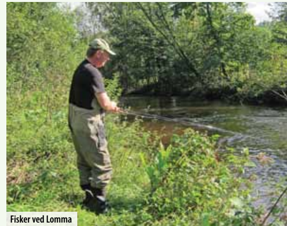
Fisker ved Lomma

Man må også komme seg langs Østernbekken frem til Grini Næringspark, og derfra langs bekken fra