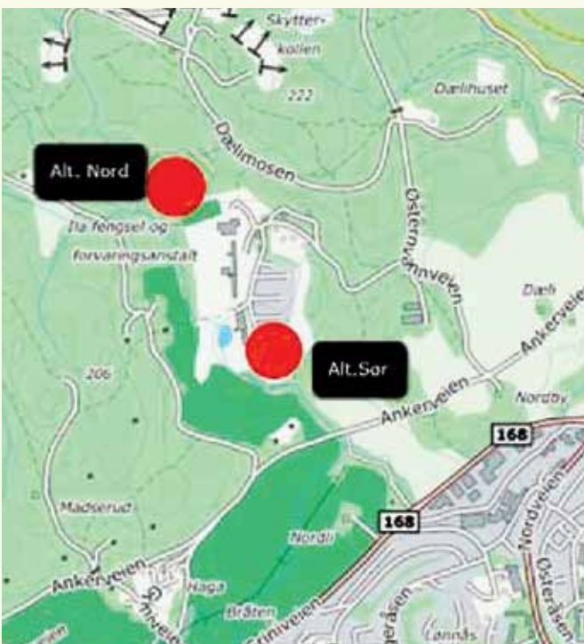
Kart som viser de to forslagene til plassering av RSA innenfor markagrensen hhv nord og sør på Ila i Bærum. (Bærum kommune saksnummer 17/23777.)