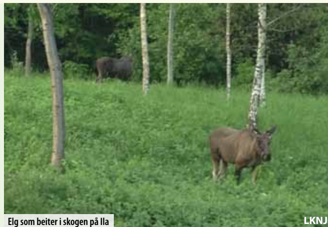
Elg som beiter i skogen på Ila