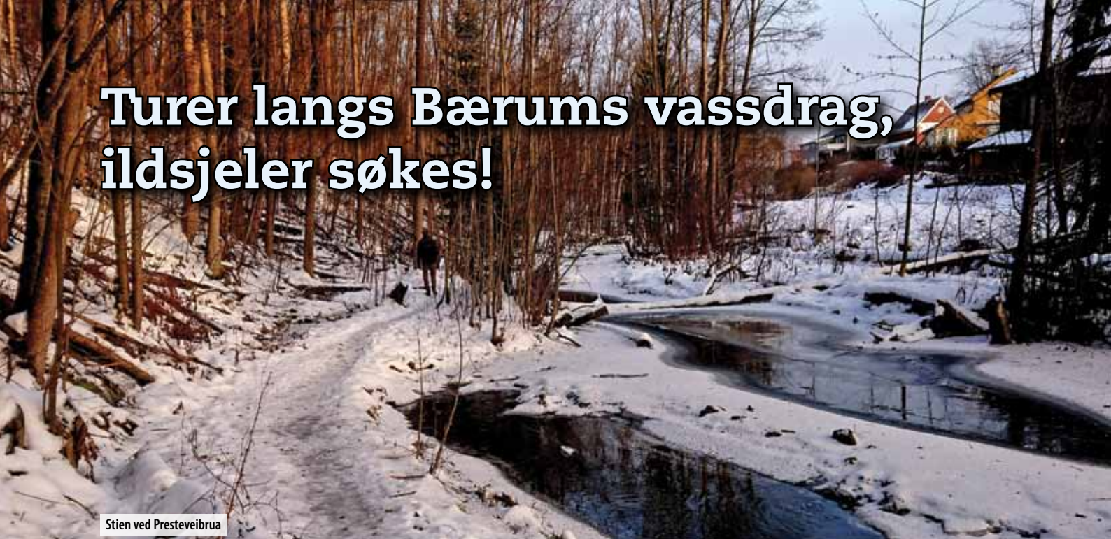
Stien ved Presteveibrua