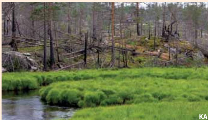
En skogbrann har gitt store mengder brannskadde trær, brent ved og flekker med mineraljord. Våtmarken i forkant har stoppet brannens spredning.

Det antas at vi har over 100 arter i Norge som er mer eller mindre avhengig av skogbrann! Mange av disse er oppført på rødlisten, derav mange biller. En del arter, spesielt insekter og sopp, har spesialisert seg på å utnytte de store mengdene av næring som plutselig frigjøres ved brann. Andre arter er raskt på plass for å utnytte de store soleksponerte flatene som blir dannet, der få konkurrenter og potensielle predatorer har overlevd brannen. Varmen i seg selv dreper mange arter, mens enkelte planter trenger varmen for at frøene deres skal spire. På den brente bakken dukker det opp branntilpassede begersopper. Den brente veden og de brannskadde trærne er et skattekammer for både brannstubbeler, vedboende sopp og insekter. De mest spesialiserte artene er raskt på plass etter brann, mens andre utnytter brent ved og brannskadde trær i flere tiår etter brannen.