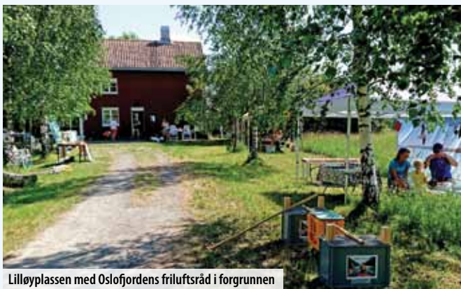
Lilløyplassen med Oslofjordens friluftsråd i forgrunnen