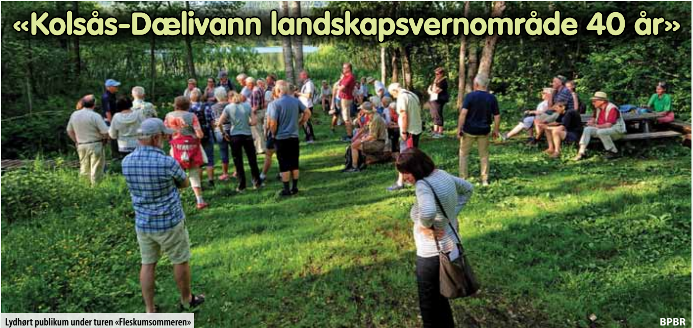
Lydhørt publikum under turen «Fleskumsommeren»