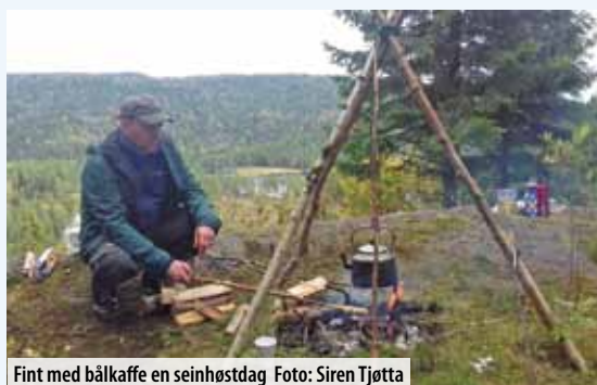
Fint med bålcaffe en seinhøstdag

Søndag 22. september mellom kl.11 og 15 har du sjansen! NiB har stand langs veien inn mot Burudvann, ved inngangen til stien til Kirkebykollen. Derfra har vi merket stien opp til toppen (ca. 20 minutter å gå). NiB serverer kaffe / saft og pinnebrød som kan grilles på bålet og du kan teste dine naturkunnskaper i en «naturquiz». Håper vi ses!