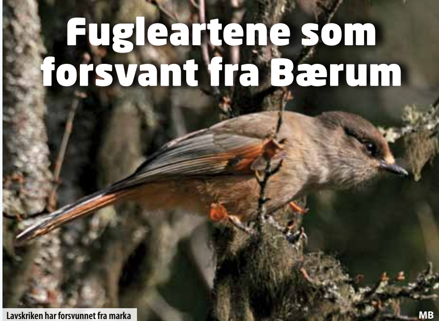
Lavskriken har forsvunnet fra marka