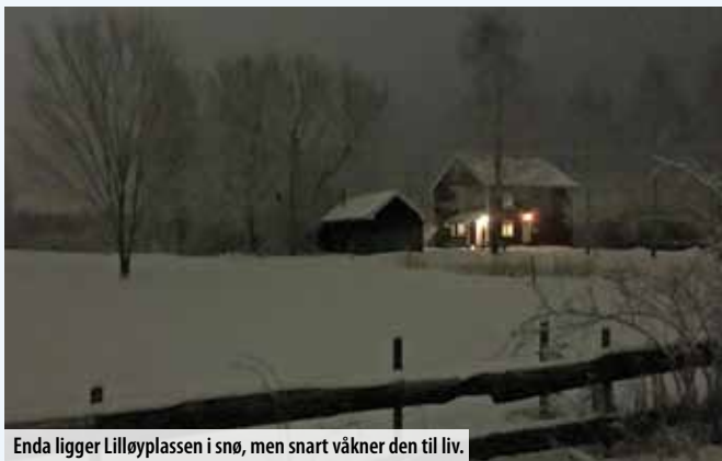
Enda ligger Lilløyplassen i snø, men snart våkner den til liv.