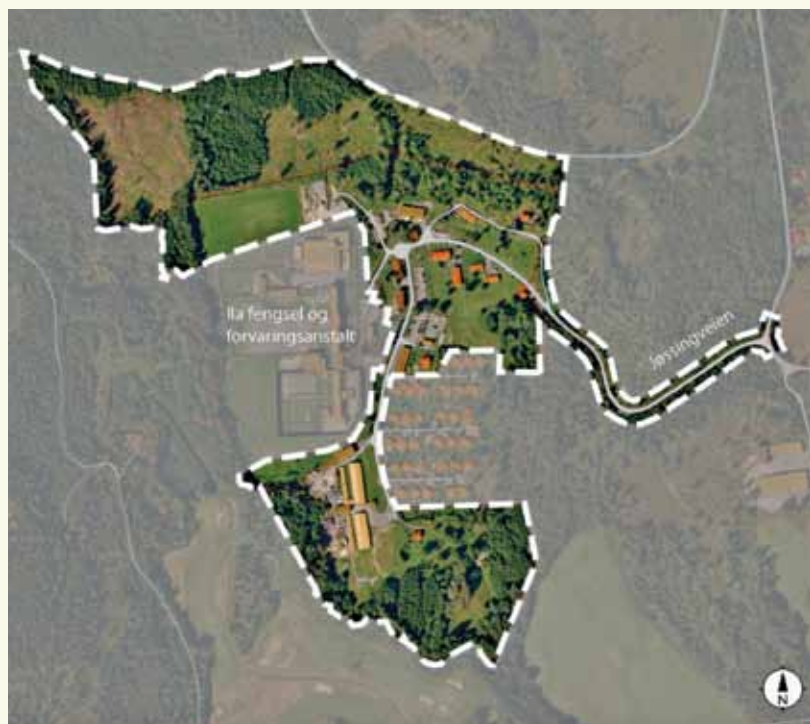
Kart over området innenfor markagrensen som vil bli berørt av en utbygging av RSA på Ila i Bærum. (Selve Ila fengsel er utenfor marka).