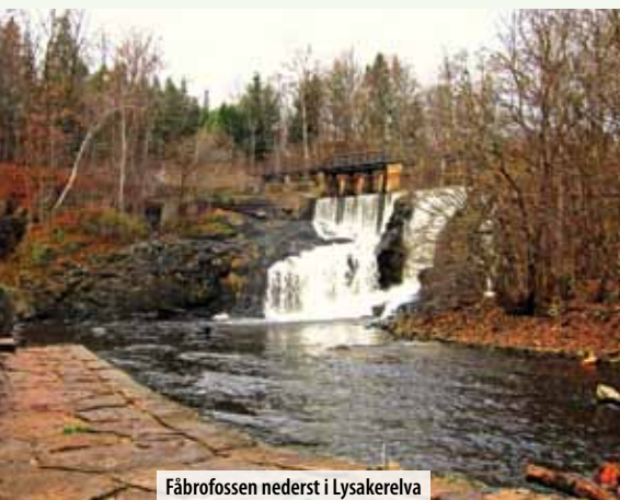
Fåbrofossen nederst i Lysakerelva

Det er gode gang- og sykkelveier og fine stier langs store deler av vassdragene våre. Der det ikke er mulig å komme