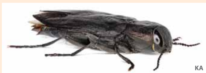
Den sårbare sotpraktbiller er avhengig av brann og har utviklet varmesensorer på brystet!

Både i Sverige og Finland utføres kontrollerte branner i skog for å fremme artsmangfoldet knyttet til brann. Dette er ennå ikke prøvd ut i Norge. For å få mest mulig ut av tiltaket er det viktig å velge områder utfra der brann vil gi størst nytte for mangfoldet. Vi bør for eksempel ikke brenne gammel naturskog som i dag har store naturverdier knyttet til andre livsmiljøer, men heller tenke på brenning som et skjøtselstiltak i eldre skog med mindre biologiske verdier i dag som kan bli en hot-spot for disse artene. Det viktigste er at det brennes i et landskap der skogbrann fortsatt forekommer og der det fortsatt finnes naturverdier knyttet til gammel furuskog. Brannartene må finnes i landskapet for å kunne komme seg til brannfeltet. Det vil ta litt tid å få på plass en slik ordning