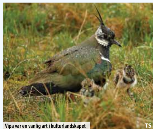
Vipa var en vanlig art i kulturlandskapet

Senere på året, særlig i juni, kunne man om natten høre den monotone og langvarige "krekssingen" fra åkerriksa . På latin heter åkerriksa Crex crex , og det viser til lyden: gjentatte og kraftige kreds-kreds som kan fortsette i mange minutter av gangen. Åkerriksa var sjelden å se, for den gjemte seg godt i gressengene. Men det ble også dens bane da man gikk over fra å slå for hånd med ljà til å bruke slåmaskiner