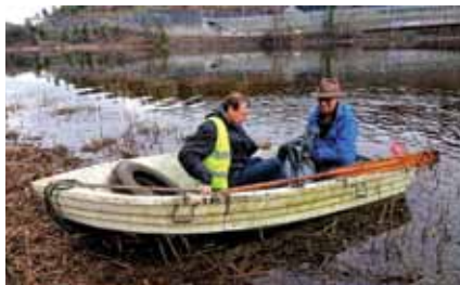
Søppelfangsten tas til lands .

Onsdag 15. august ble den andre delen av dugnaden gjennomført: Slått av den øvre delen med ljà og kantskjøtsel med store hagesakser og liten sag. Uønskede tresorter som lønn, ask, gran ble fjernet og kanten av enga ble åpnet opp for å slippe inn lys i skogen og for å få frem større furutrær og frukttrær. Det hele ble avsluttet med en hyggelig samling der vi spiste kake bakt av dugnadsleder Zsuzsa. Det var til sammen 21 personer som deltok på slåttedugnaden