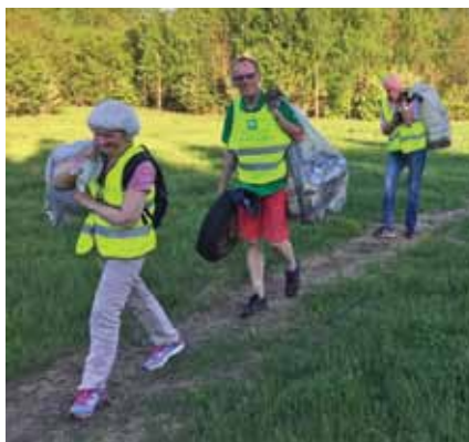
Glade dugnadsfolk bærer tungt.