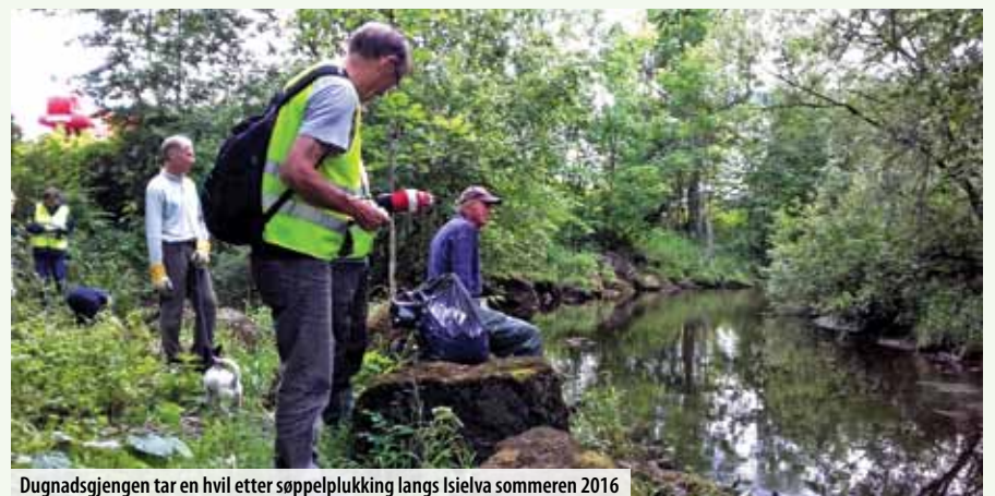
Dugnadsgjengen tar en hvil etter søppelplukking langs Isielva sommeren 2016