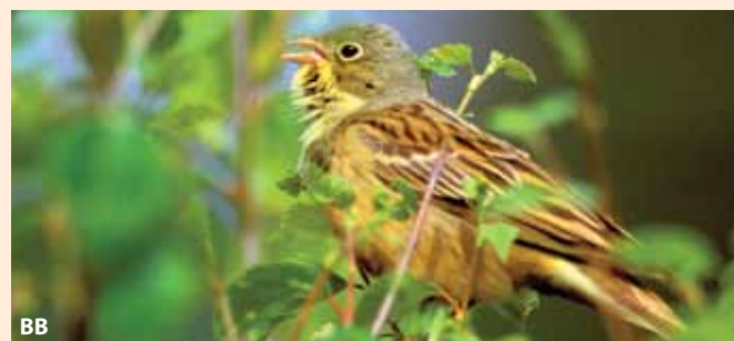
Hortulanen synger i løvkratt på gammelt brannfelt.

De mest kjente brannartene er imidlertid de to brannavhengige plantene bråtestorkenebb og brannstorkenebb, der kun den førstnevnte er funnet i Norge. Disse to artene dukker kun en sjelden gang opp på brannfelt og frøene er