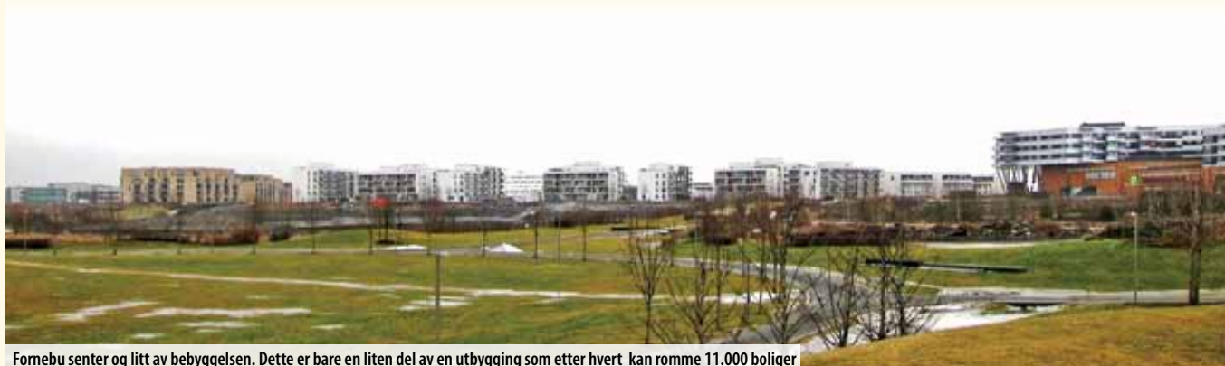
Fornebu senter og litt av bebyggelsen. Dette er bare en liten del av en utbygging som etter hvert kan romme 11.000 boliger