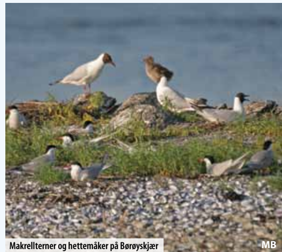
Makrellterne og hettemåker på Børøyskjær