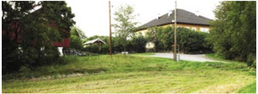
Hovedhuset og dets interior forteller at Store Stabekk var en betydningsfull gård i det tidligere Stabekk-samfunnet. På bildet skimter vi det restaurerte stabburet og dukkestuen.