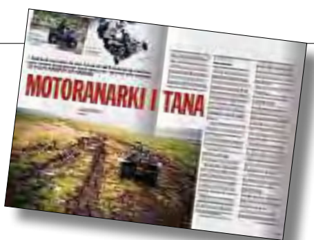
Faksimile fra Natur & Miljø nr. 3 2007

– Og vi har ikke sett slutten på dette ennå. Hver generasjon må ta kampen for vassdragsvernet på nytt. Denne gangen er det vår tur til å ta et krafttak.