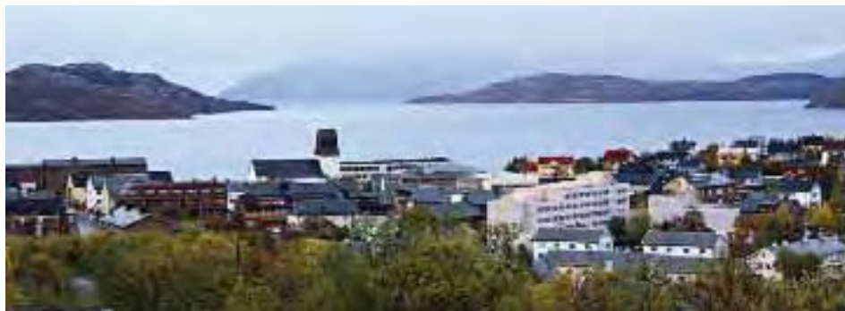
Kirkenes sentrum med Bøkfjorden i bakgrunnen. Her er det sluppet ut giftige kjemikalier fra gruvedriften uten tillatelse, mener Naturvernforbundet.

– Gruva har lov til å teste kjemikalier som er mer miljøvennlige enn det de bruker. Om kjemikaliene går i en ugunstig retning for miljøet, har de brutt utslippsvilkårene, sier Sørby.