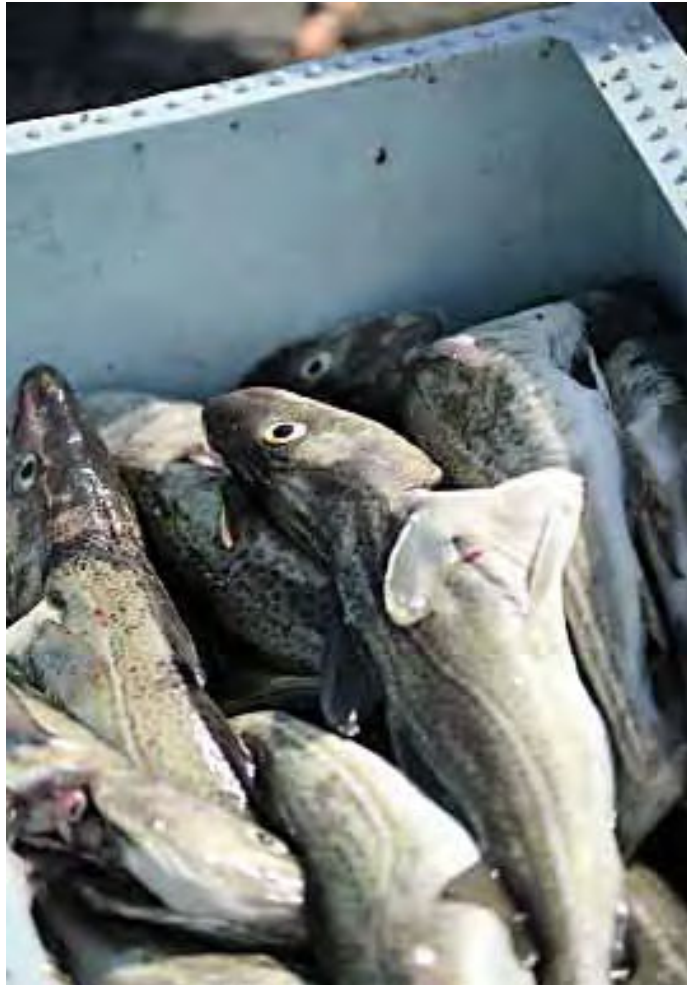
Det ble i fjor fisket 25 000 tonn sterkt truet kysttorsk i Norge. Året før ble det fanget 26 000 tonn.

Kysttorsk nord for 62. breddegrad står som sterkt truet på den norske rødlisten. De siste tyve årene er bestanden redusert med mellom 50 og 80 prosent. Bestanden er fragmentert i flere forskjellige grupper. De mest isolerte fjordpopulasjonene er verst stilt.