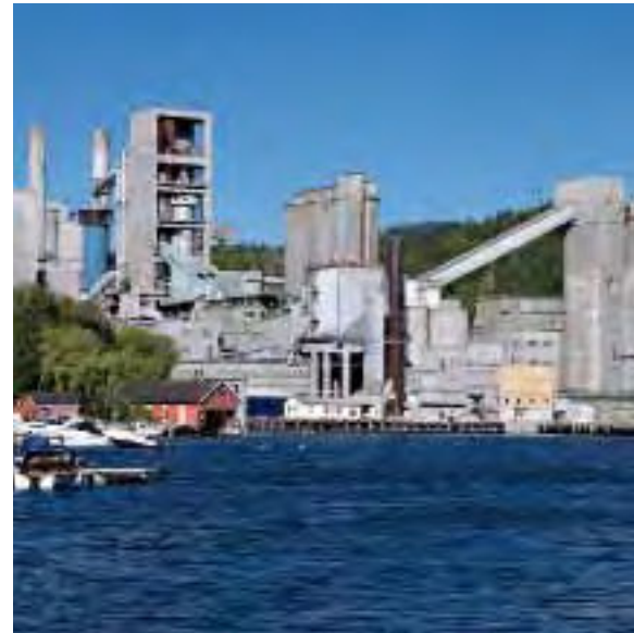
Norcem i Brevik er en av de største aktørene i det norske kvotesystemet.

I midten av mai presenterte Statistisk Sentralbyrå Norges utslipp av klimagasser for 2009. De viste at de norske utslippene av klimagasser hadde gått ned med 5,4 prosent sammenliknet med 2008. De norske utslippene er nå bare 2,2 prosent høyere enn de var i 1990. Det var andre år på rad