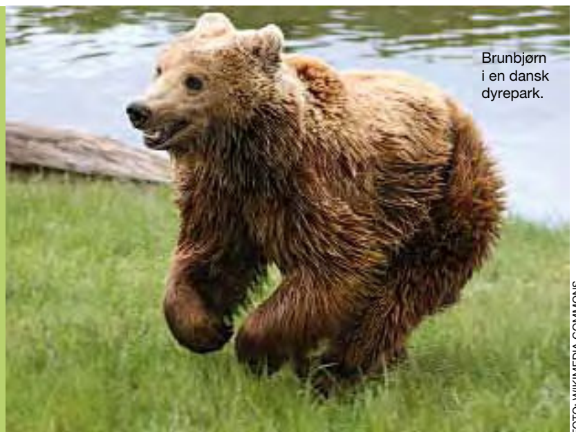
Brunbjørn i en dansk dyrepark.

Den nye norske rødlista skal legges fram i november.