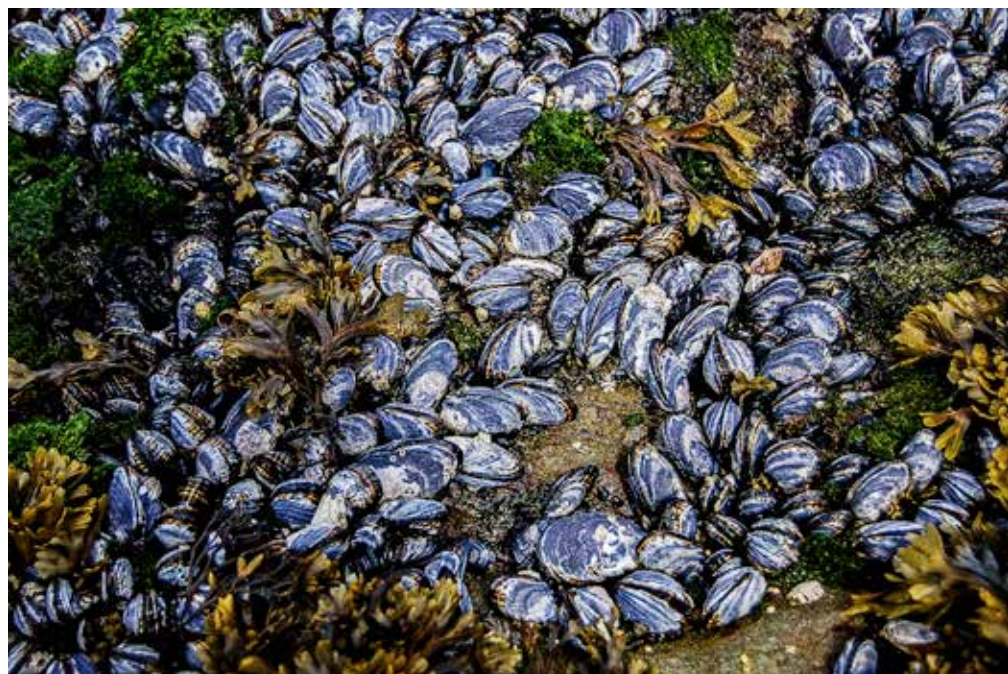
SPISER PLAST: Blåskjell