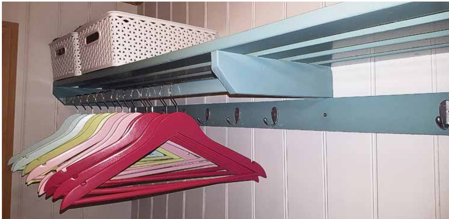
En gammel seng ble ei fin hylle.