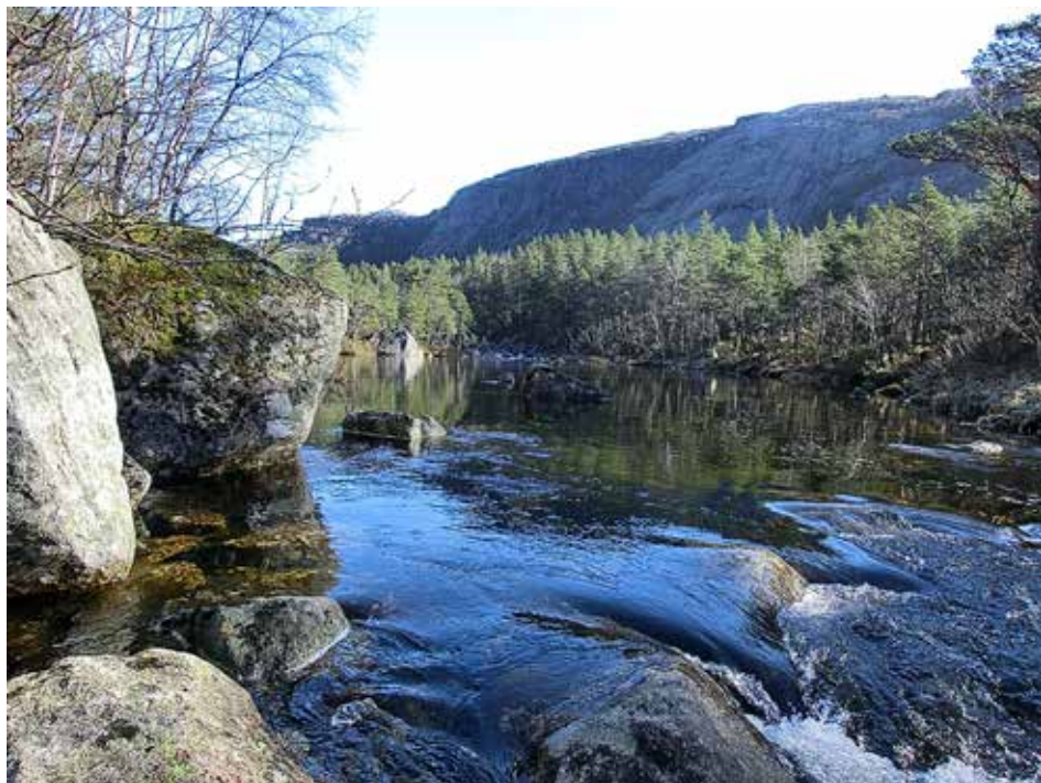
Skurvedalsåna er reddet fra utbygging.