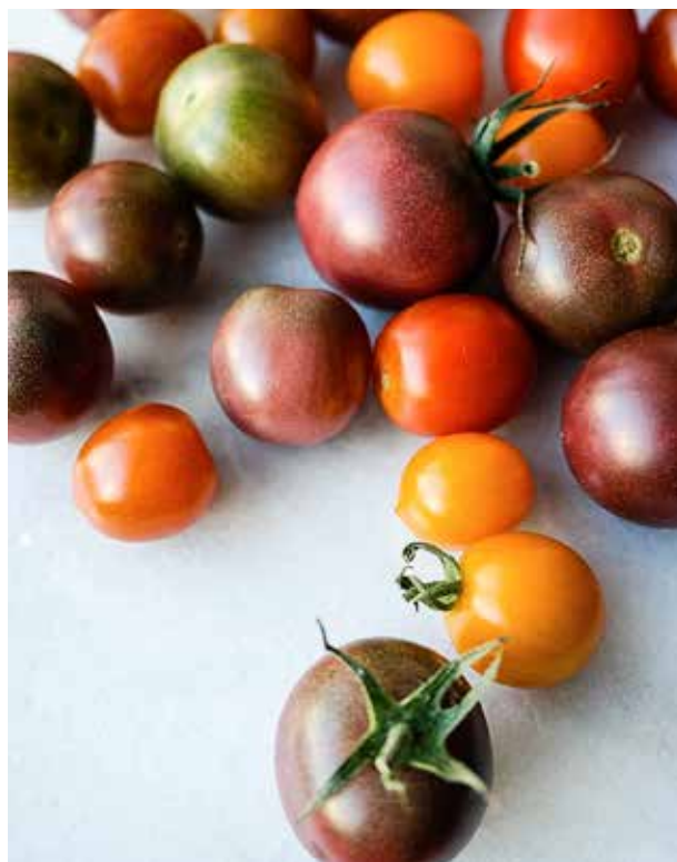
Mias middelvei: – Det har vært viktig for meg å ikke være så streng med meg selv at jeg ikke kan kjøpe tomater pakket inn i plast uten enorme kvaler, sier Mia.