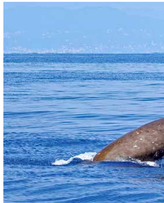
SPISER PLAST: Gåsenebbhval

Forskere ved Universitetet i Uppsala fikk seg en overraskelse da de plasserte abbor i vann-tanker med forskjellig innhold av mikroplast. Det viste seg at de små abborne ble hektet på plast, omtrent som ungdommer spiser «fast food».