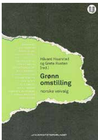
Grønn omstilling – norske veivalg Håvard Haarstad og Grete Rusten (red.) Universitetsforlaget, 2018