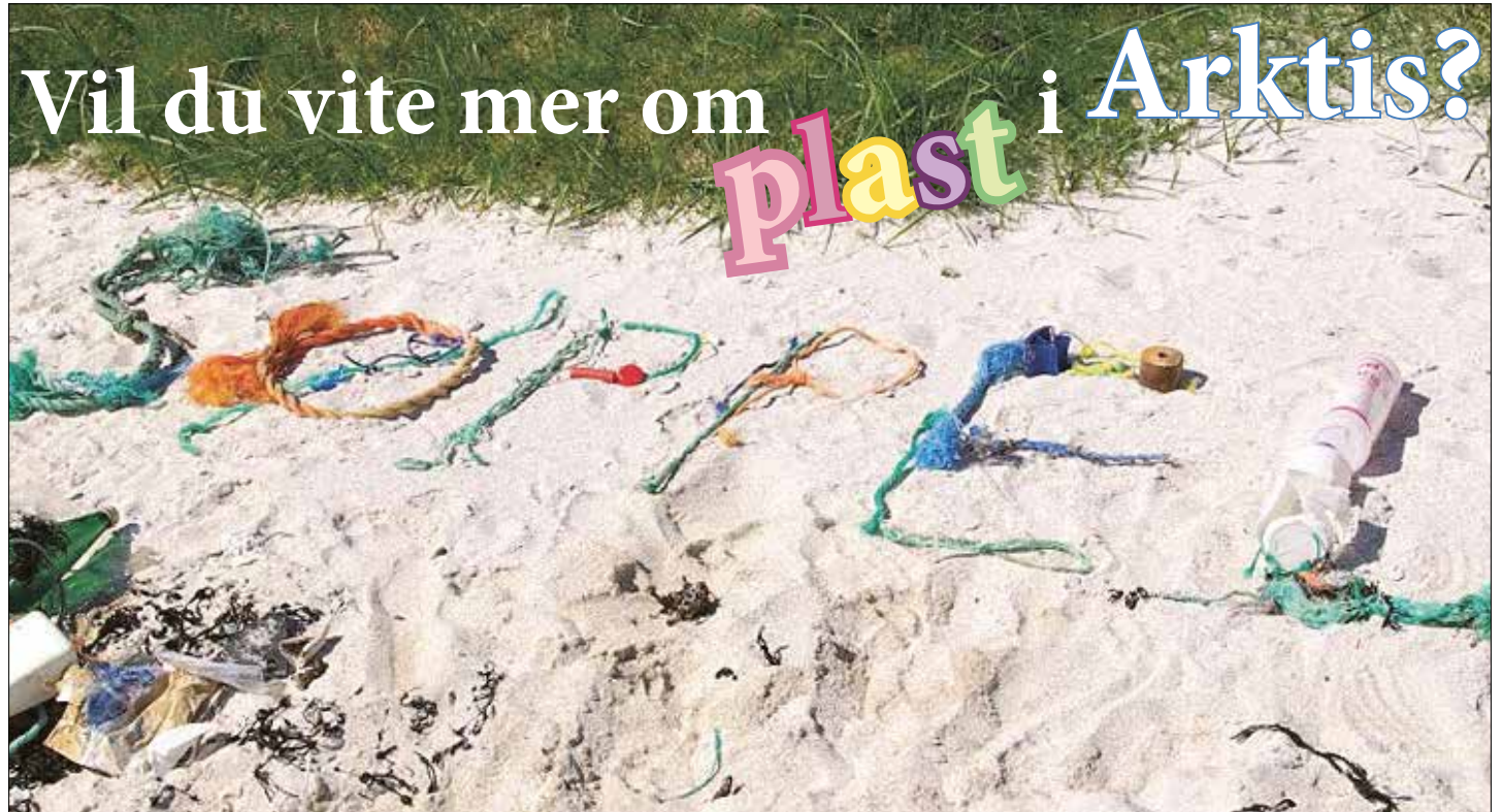
Foto: Geir Wing Gabrielsen. Grafisk design: Jan Roald, Norsk Polarinstittutt