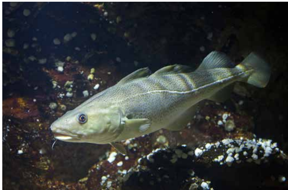
SPISER PLAST: Torsk