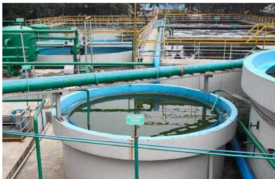
Det meste av tekstilindustri er nå i Asia. Bildene viser en fabrikk i Bhaluka i Bangladesh, som ble besøkt av Center for Business and Human Rights, NYU Stern School of Business, i 2015.

Rapporten Klepp nylig publiserte, peker på tre hovedtiltak for å redusere utslippene. Reduksjon i forbruk av klær og tekstiler, forbedringer i bruken av syntetiske plagg og erstatning av syntetiske fibre med naturlige.