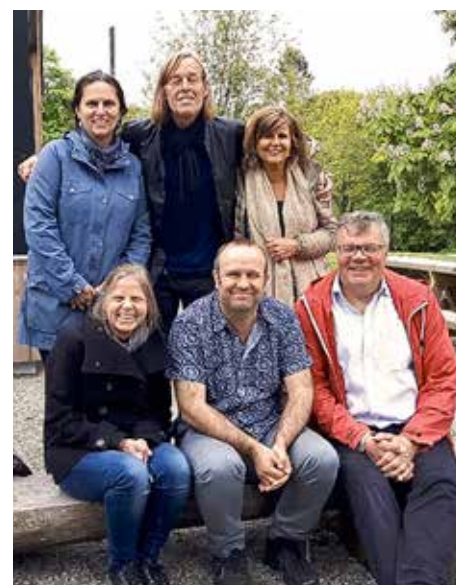
Styret i Naturvernforbundet i Rogaland er vertskap for årets landsmøte.