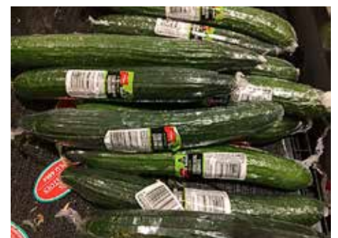
Å pakke grønnsaker og annet i plastfilm minsker ikke nødvendigvis matkastingen.