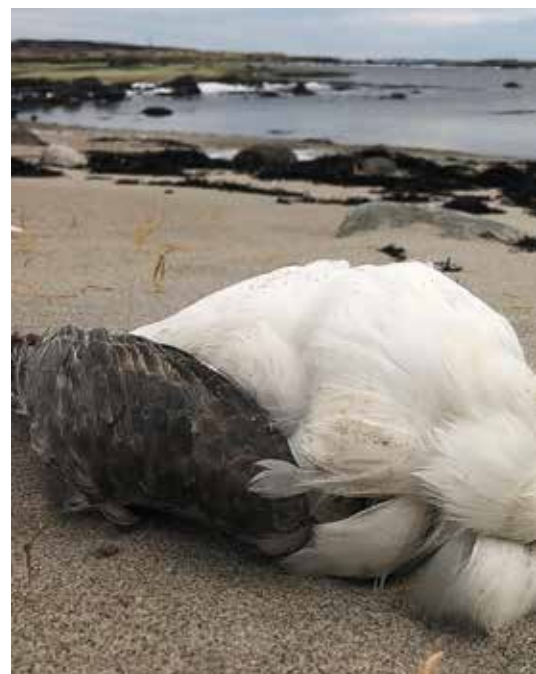
SPISER PLAST: Havhest

– Fisken som ble klekket ut i vann med store mengder mikroplast var «mindre, langsommere og dummere» enn de som ble klekket ut i rent vann, fortalte professor Oona Lönnstedt til BBC News da deres rapport ble lansert i 2016.