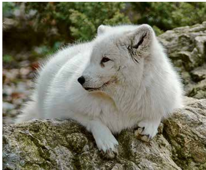
Fjellrev i vinterpels.

– For fjellreven er det svært alvorlig at delbestandene i nord nå er på randen av utdøing, og det blir avgjørende at miljømyndighetene prioriterer tiltak i denne regionen. Her må det set-