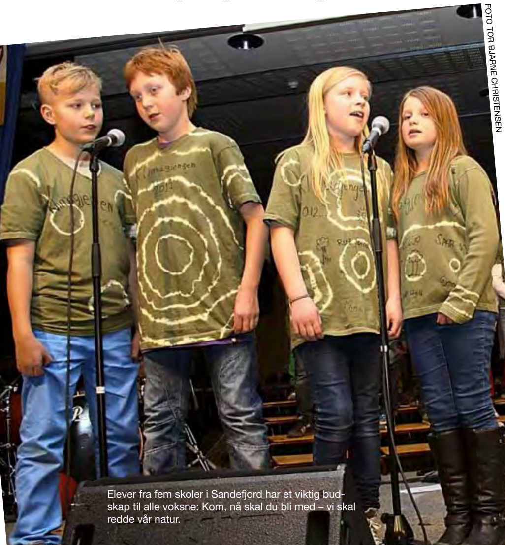
Elever fra fem skoler i Sandefjord har et viktig budskap til alle voksne: Kom, nå skal du bli med – vi skal redde vår natur.

Miljøagentene var med da fem skoler i Sandefjord ga ut miljøplate i mars. Elevene har som mål at halvparten av Norges befolkning skal støtte en bedre klimapolitikk.