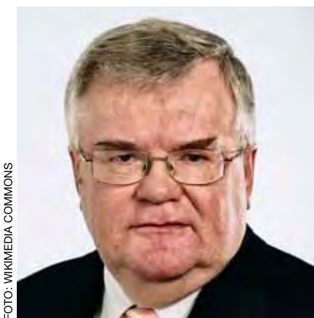
Tallinns ordfører Edgar Savisaar ønsker gratis kollektivtrafikk i byen.