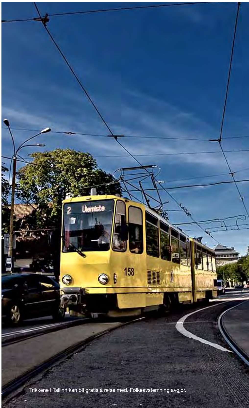
Trikkene i Tallinn kan bli gratis å reise med. Folkeavstemning avgjør.