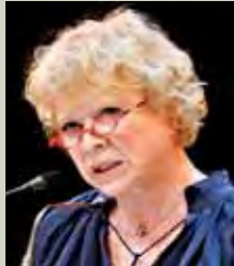
Eva Joly er tildelt Sofieprisen for 2012.