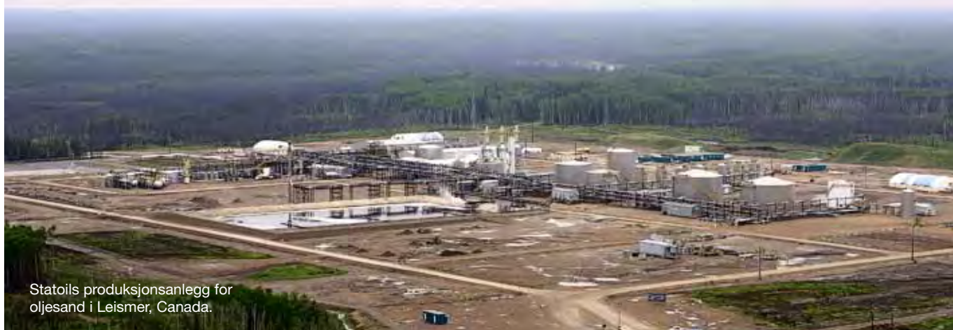
Statoils produksjonsanlegg for oljesand i Leismer, Canada.

Store mengder demonstranter protesterte i november utenfor Det hvite hus, i protest mot byggingen av en rørledning som blant annet skal frakte Statoils oljesand fra Canada til USA.