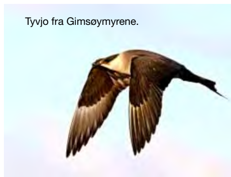
Tyvjo fra Gimsøymyrene.