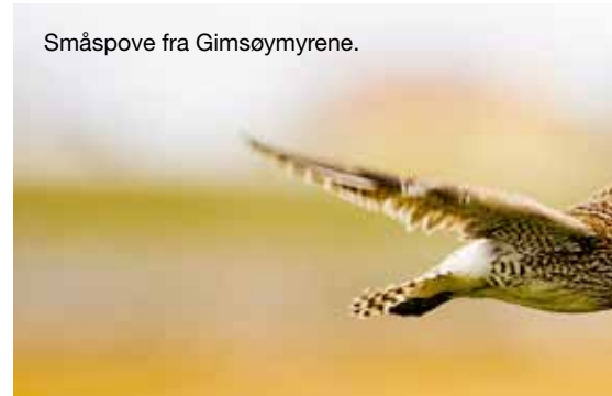
Småspove fra Gimsøymyrene.

Det er selvfølgelig ikke lov å bygge en flyplass i et naturreservat. Skal Avinor få sine ønsker oppfylt må de enten få dis-