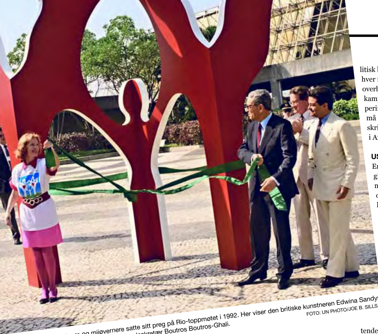
Aktivister, kunstnere og miljøvernere satte sitt preg på Rio-toppmøtet i 1992. Her viser den britiske kunstneren Edwina Sandys frem sitt verk til FNs daværende generalsekretær Boutros Boutros-Ghali.

litisk behandles de ofte hver for seg. Helheten og overblikket forsvinner i kampen om enkeltgrupperings kjepphester. Vi må tenke mer på tvers, skriver de to i en kronikk i Aftenposten.