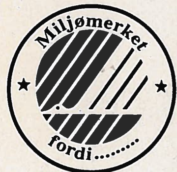
Omtrent slik blir utseendet på det offisielle miljømerket.

Det ligger an til at de fleste nordiske land blir med på den samme ordningen. Dermed blir det det samme merket du skal se etter når du er på shoppingtur i Arvika, som når du handler i din egen nærbutikk. Litt vanskeligere å finne de mest miljøvennlige produktene kan det bli i Danmark, danskene er foreløpig avventende på grunn av sitt EF-medlemsskaap. EF jobber nemlig også med å forberede miljømerking i sine medlemsland.