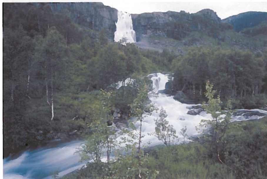
Regjeringen har presentert en utbyggingsplan som skal "legge til rette for ny kraftproduksjon uten omfattende naturinngrep" i Sauda.