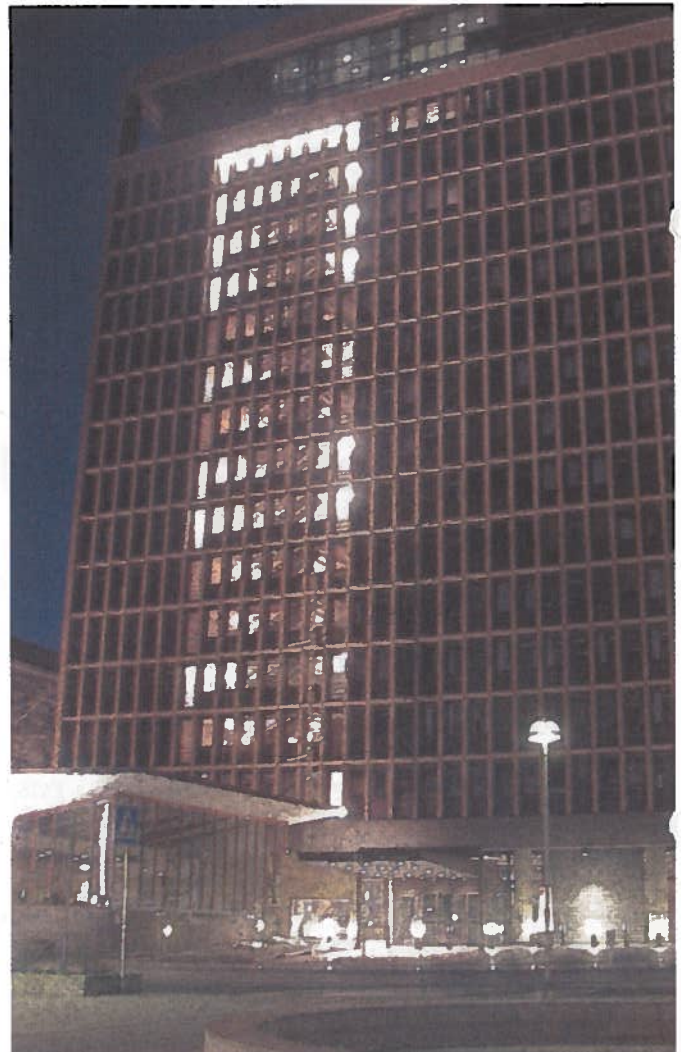
Lyset er på - ingen er hjemme? Slik er det nødvendigvis ikke lenger i statlige bygg etter at prosjektet Grønn stat ble puffet i gang av statsråd Børge Brende. Men litt lys i de offentlige trappene skal det tydeligvis likevel være — også nattetid.