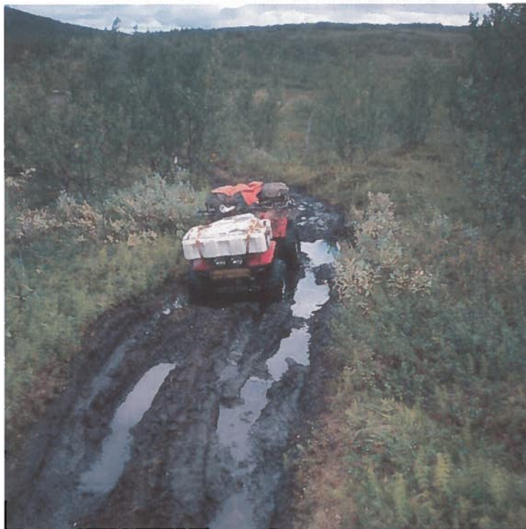
Dype sår i terrenget. Dette er hva Naturvernforbundet frykter blir resultatet av ukontrollert kjøring med lett-traktorer.

Stadig flere kjøper lett-traktor for å kjøre i terrenget. Men selv om enkelte kommuner har lempet på regelverket, er det mye som tyder på at reglene for slik kjøring kommer til å bli strammert inn.