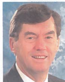
— Jeg mener forslaget gir en god balanse mellom vernehensyn og ønsket om en viss kraftutbygging, sier olje- og energiminister Einar Steensnæs

håp om bredt flertall for Regjeringens forslag i Stortinget. — Jeg mener forslaget gir en god balanse mellom vernehensyn og ønsket om en viss kraftutbygging. Men det er vel kjent at flere partier på Stortinget ønsker å bygge ut etter NVEs forslag. Noen ønsker også mindre utbygging. Derfor tror jeg Regjeringens forslag står seg godt, sier Steensnæs til Natur & miljø Bulletin.