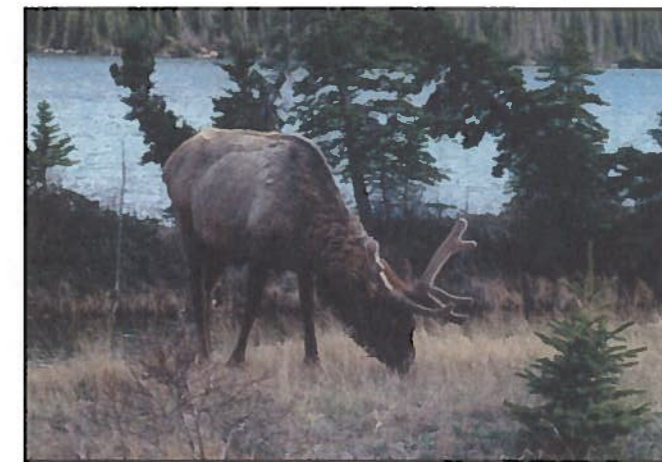
Wapiti-hjorten lider av et "søskenbarn" av kugalskap.

Amerikanske myndigheter tar likevel ingen sjanser, og anbefaler jegere å bruke gummihandsker under parteringen, samt unnlåte å spise hjerne og ryggmarg fra viltet.