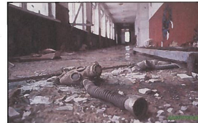
Forlatt ungdomskole i Tsjernobyl. Nå vil ukrainske myndigheter bygge nytt atomkraftverk.