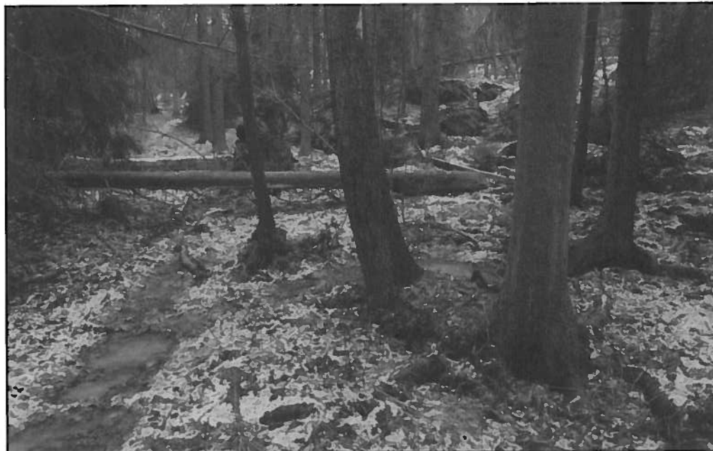
Skogplanting har blitt ansett som et tiltak mot klimaendringer, men skogen kan gjøre vondt verre.

Skogplanting i nordområdene kan bidra til global oppvarming. Årsaken er at skogen absorberer varme fra sola. Snødekte flater uten skog reflekterer derimot større deler av solvarmen, viser ny forskning.