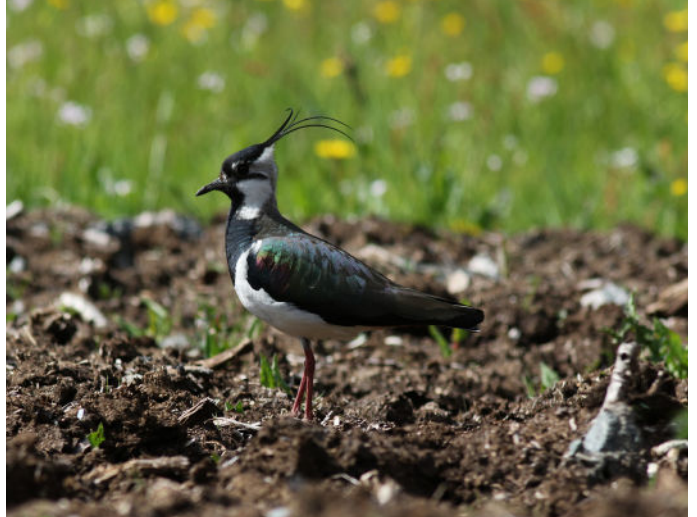
Vipe på Unneland i 2016.