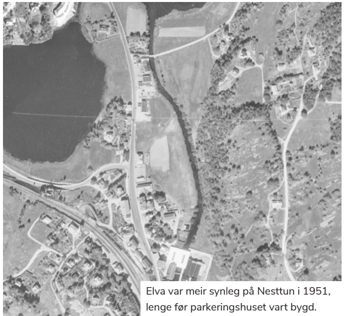
Elva var meir synleg på Nesttun i 1951, lenge før parkeringshuset vart bygd.