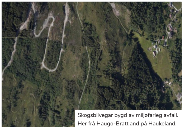
Skogsbilveggar bygd av miljøfarleg avfall. Her frå Haugo-Brattland på Haukeland.