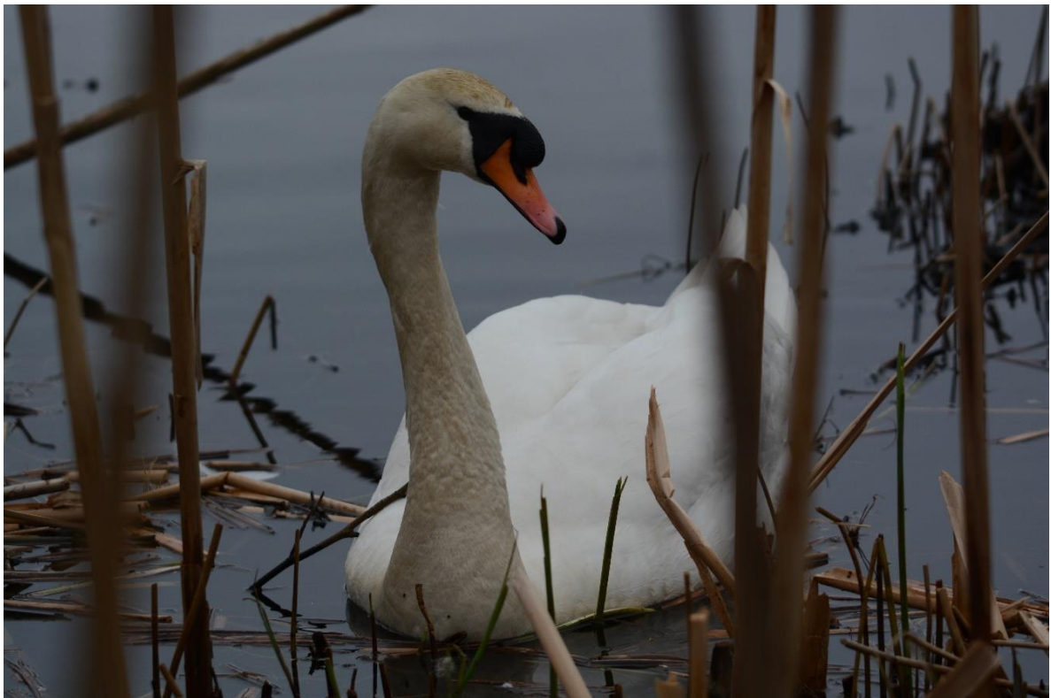
Bilder fra Solheimsvatnet (13. april 2023), som viser de hekkende artene sothøne og knoppsvane – i kantvegetasjonen.