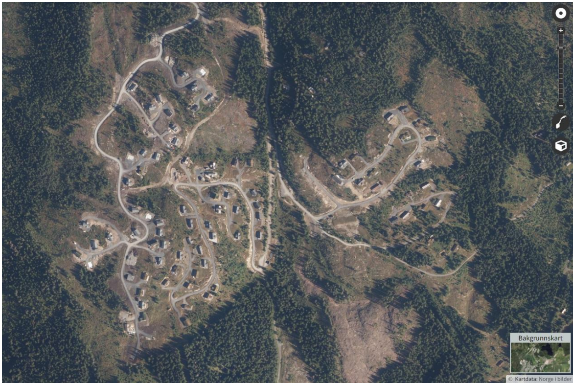
Flyfoto over eksisterende fritidsbebyggelse Elgkollen og Myllalia i vest, Orenvegen i øst. 3