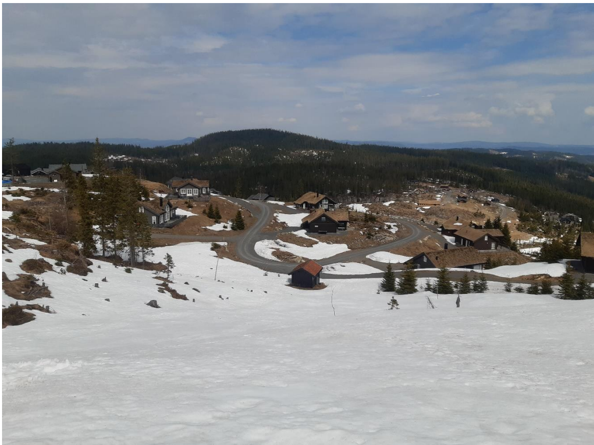
Før skog – nå fritidsbebyggelse. Bilde tatt fra Elgkollen, mai 2023.