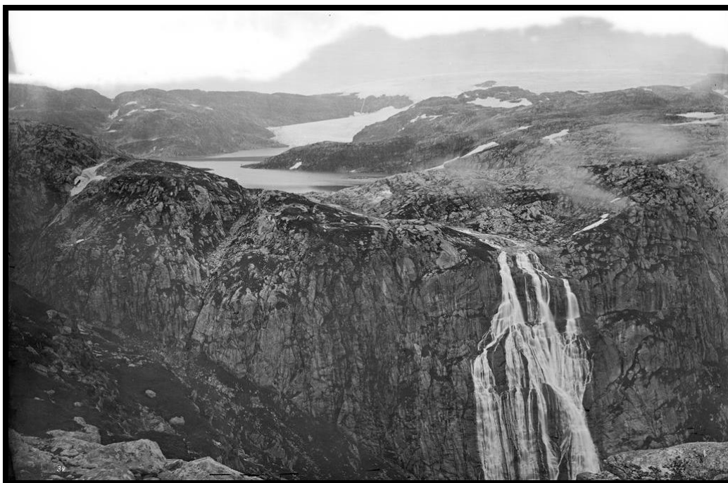
Skjørdalsfossen med Juklavatn og Folgefonna bak.

Frå Juklavatn renn Skjördalsfossen ut. Dette var den fossen av dei fire store som var vanskelegast å finna. Men kanskje den fossen som gav mest. Slik skreiv ein kar som kalla seg "–p." i Den Norske Turistforenings årbok for 1875: « Men pludselig bryder solen gjennom tågen: Juklevandets blågrå speil ligger foran os i få skridts afstand og på den modsatte side Folgefonnen, som her næsten lodret skyder lige ned i vandet. Store isstykker, der efterhvert have revet sig løs fra bræen, flyde omkring i vandet. (...) Det er meget sandsynligt, at Skjørdalsfossen ikke kan måle sig med Vøringsfossen og Skjæggedalsfossen, hva vandmængden angår, men den hele tur med Juklevand og Folgefonnen anser jeg for langt mer interessant end en tur til de to sidtsnævnte »