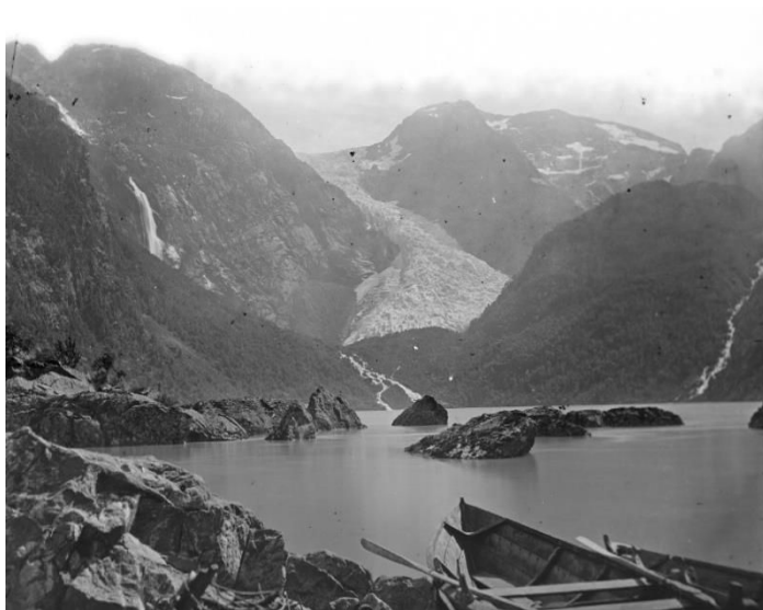
Bondhusdalen, Brufoss til venstre. K. Knudsen, UiB Folkemuseum

frå Fønderdalen og frå Bondhusbreen. Og Brufossen, ført opp som den tiande høgaste fossen i landet på internett. Brufossen stod markert i landskapet rett ved Bondhusbreen.