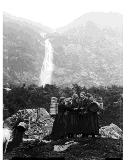
Brufoss.

Den legendariske turisthistoria frå andre halvdel av 1800-talet og fram til første verdskrigen grunna seg på Bondhusdalen, ridevegen med alle svingane opp til Gardshammar, Bondhusbreen, Bondhusvatnet, ridevegen frå Austrepollen og like fin veg ned på andre sida av Folgefonna til Odda. Saman med fossefalla Brufoss og Sundefossen, Sunndal pensjonat og hestetransport over Folgefonna og Mauranger i seg sjølv er dette landskjent historie. Kunstnarar som Amaldus Nielsen og Anders Askvold kom óg og fann motiv her. Etter at Fonnabu vart bygd, har Bondhusdalen vore sentral i friluftslivet på Folgefonna.