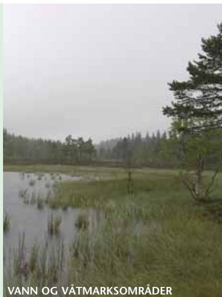
VANN OG VÅTMARKSOMRÅDER