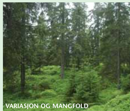
VARIASJON OG MANGFOLD

Våre sanser tiltrekkes av kontraster i skogen og langs stien vi går på. Variasjon i treslag, tetthet og trestørrelse bidrar sterkt til hvordan skogen oppleves, og hvordan skogen former ulike “rom”. Mangfold i undervegetasjonen, topografi og landskap er også viktig. Slik sett kan en ren granskog være svært variert, dersom trærne er av ulik alder og størrelse.