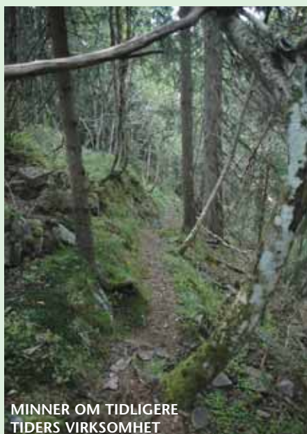
MINNER OM TIDLIGERE TIDERS VIRKSOMHET

Spor etter tidligere tiders virksomhet er viktige innslag i vår opplevelse og i vår identifisering i eventyrskogen. Miljøelementer som er bærere av historie på det personlige plan ("mitt tre" etc.) så vel som på det kollektive plan (kulturminner etc.) gjør at vi føler fortiden tilstede i nåtiden, at vi er forbundet med det forgangne gjennom noe ytre som forblir det samme gjennom alle forandringene.