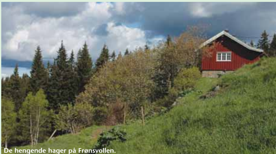
De hengende hager på Frønsvollen.

Fra 1880 og fram til høsten 2006 har det bodd folk på Frønsvollen, først skogsarbeidere, dernest folk som hadde oppsyn med skihytta, og til slutt private. Bystyret vedtok i 2005 at kommunens hus primært skulle leies ut til foreninger, og fra høsten 2006 gikk leiekontrakten over til Naturvernforbundet i Oslo og Akershus.