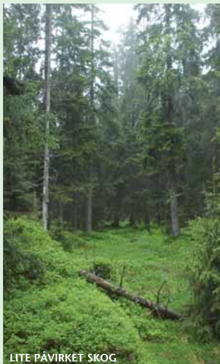
LITE PÅVIRKET SKOG

Alderen på skogen er lettest å se på barken. Glatt bark betyr hurtig diametervekst (ungdom), mens grov, skorpete bark forteller om eldre trær. Størrelsen på et tre er ikke nødvendigvis i samsvar med alderen. Et undertrykket tre med 15 cm diameter kan være eldre enn et stort tre som har hatt fri bane og hurtig vekst.