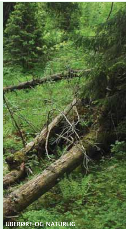
UBERØRT OG NATURLIG

Kjennetegn på naturlig skog er blant annet en variert alderssammensetning, en del døde trær (stående eller liggende, gadd eller læger), og rikt lyng- og busksjikt.