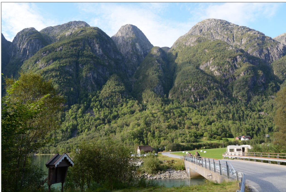
Det karakteristiske fjell-landskapet i Mauranger.