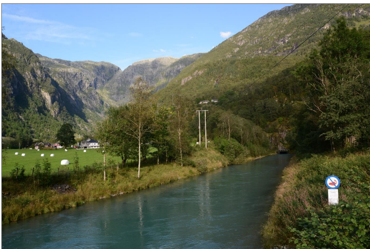
Kanalen som leder vannet fra Mauranger kraftverk ut i Austrepollen, og videre ut i Maurangerfjorden. Austrepollelva renner ut omtrent 200 meter nord for kanalen. Bilde tatt 22. august 2022.