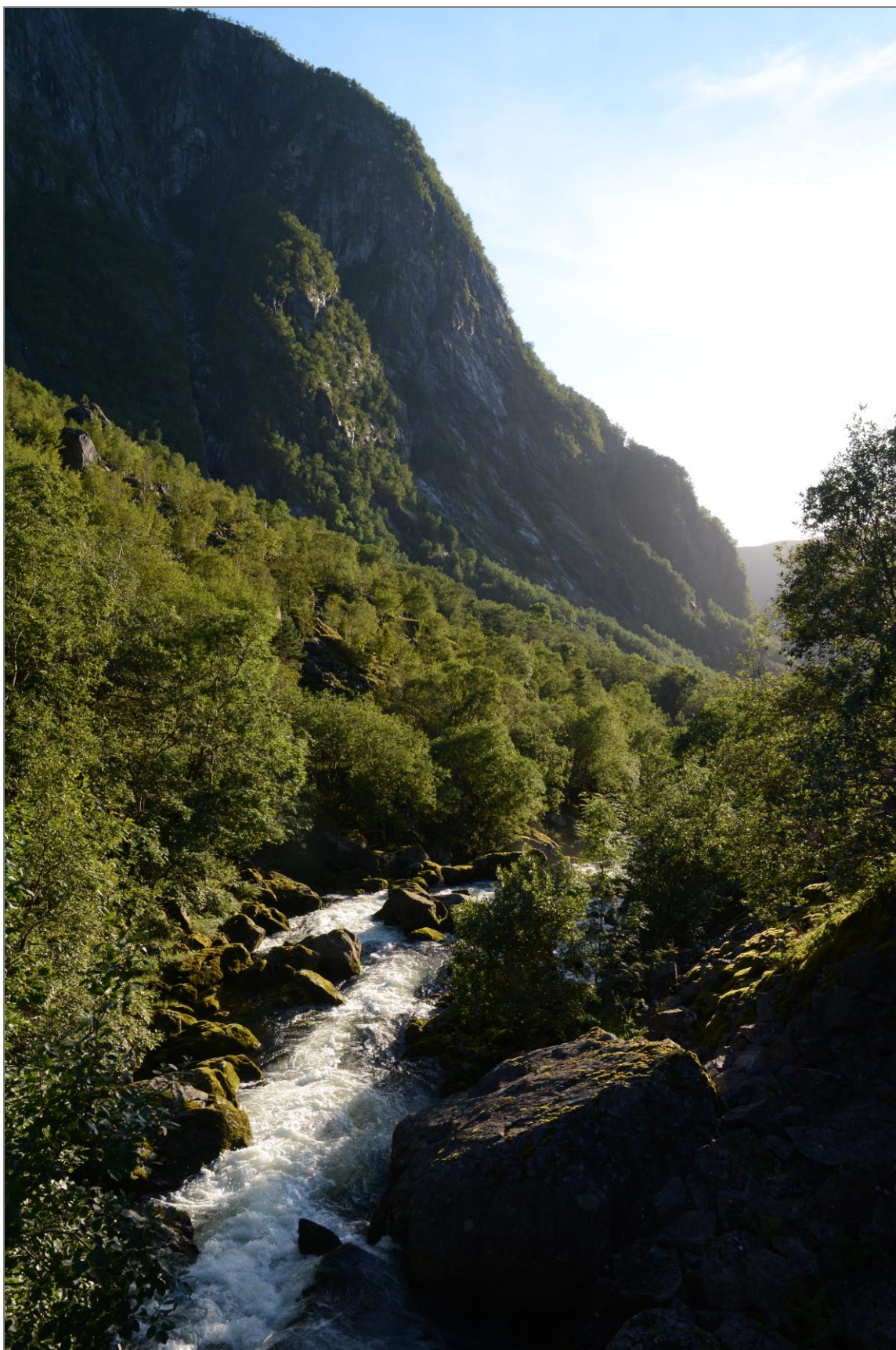
Øyreselva – viktig både for naturmangfold og som landskapselement. Her er elva fotografert omtrent 1,4 km (omtrent 100 moh.) oppstrøms utløpet i Nordrepollen, den 22. august 2022.