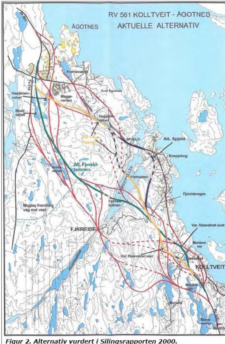
Figur 2. Alternativ vurdert i Silingsrapporten 2000.

Det var svært mange alternativer av ny vei mellom Kolltveit og Ågotnes som ble vurdert i år 2000. Mange av alternativene kom også ut med omtrent samme samfunnsøkonomiske nytteverdi, dog negativ nytteverdi. Også tunnel gjennom Spjeldsfjellet var et alternativ – noe som ville hatt stor positiv effekt for friluftsliv, landskap, store myrområder, kystlynghei, svartstrupe og eventuelt også for hubro hvis det viser seg at den har tilhold i det aktuelle området.