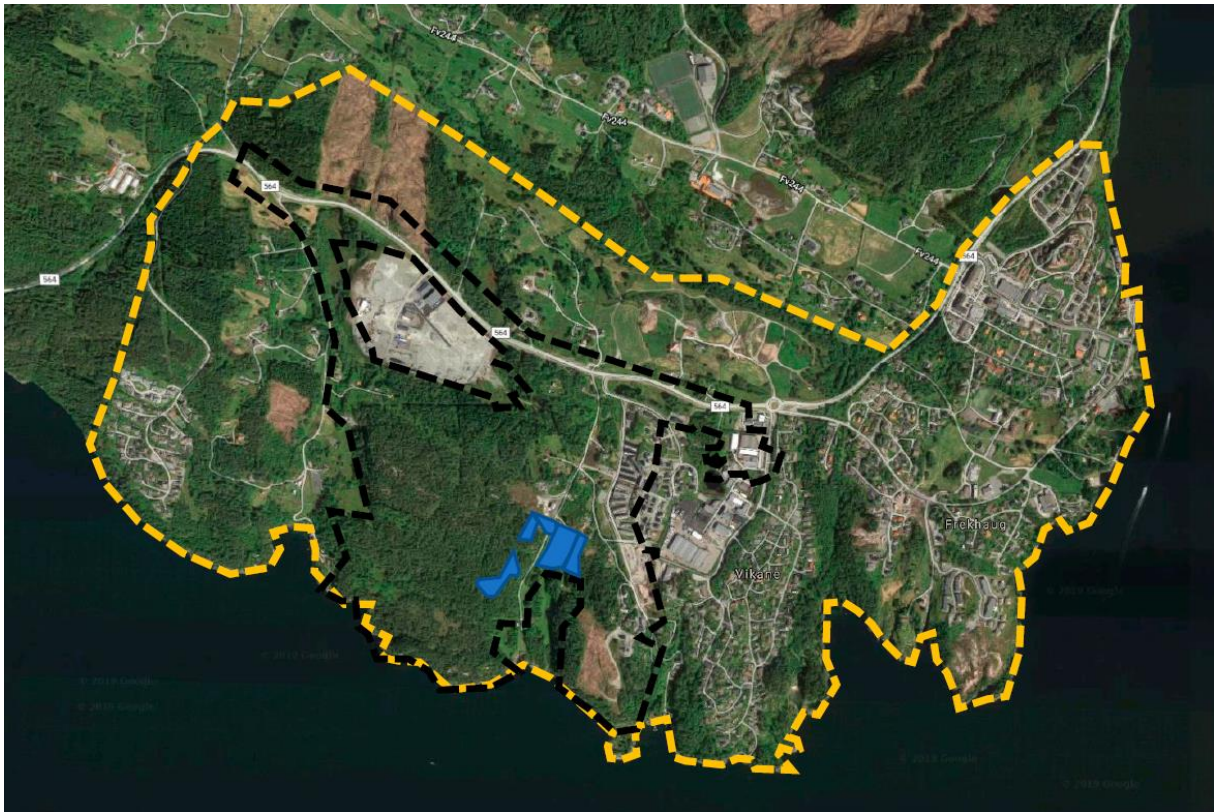
Figur hentet fra konsekvensutredningen, der plangrensa er svart stiplet linje (696,2 dekar), influensområdet er gul stiplet linje, og de fem blå polygonene er delområdene som er konsekvensutredet, og som til sammen utgjør omtrent 20 dekar.

Konklusjonen for verdi og påvirkning av naturmangfold i Konsekvensutredning for Dalstø–Mjåtveitstø (fra Ard arealplan) er vist nedenfor, og viser at naturverdiene som er utredet, er uten betydning og at påvirkning, som følge av at reguleringsplanen blir realisert, er ubetydelig . Denne klassifiseringen skyldes at konsekvensutredningen kun dekker et svært lite område av planens totale areal.