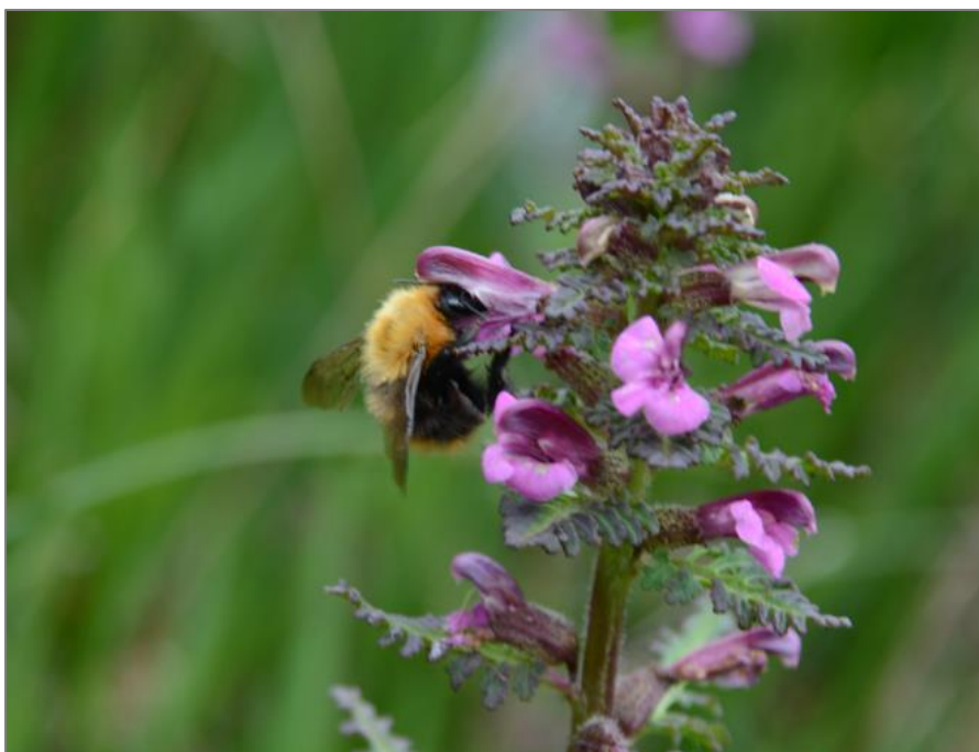
Figur 1. Kysthumle på myrklegg på den største myra i I/L2 i juni 2022. Arten ble for øvrig funnet igjen på samme myra i juni 2023. Dokumentasjon av arten er vurdert av forfatter av naturmangfoldrapporten (Opus), og arten er bekreftet (gjelder bildet fra 2023).