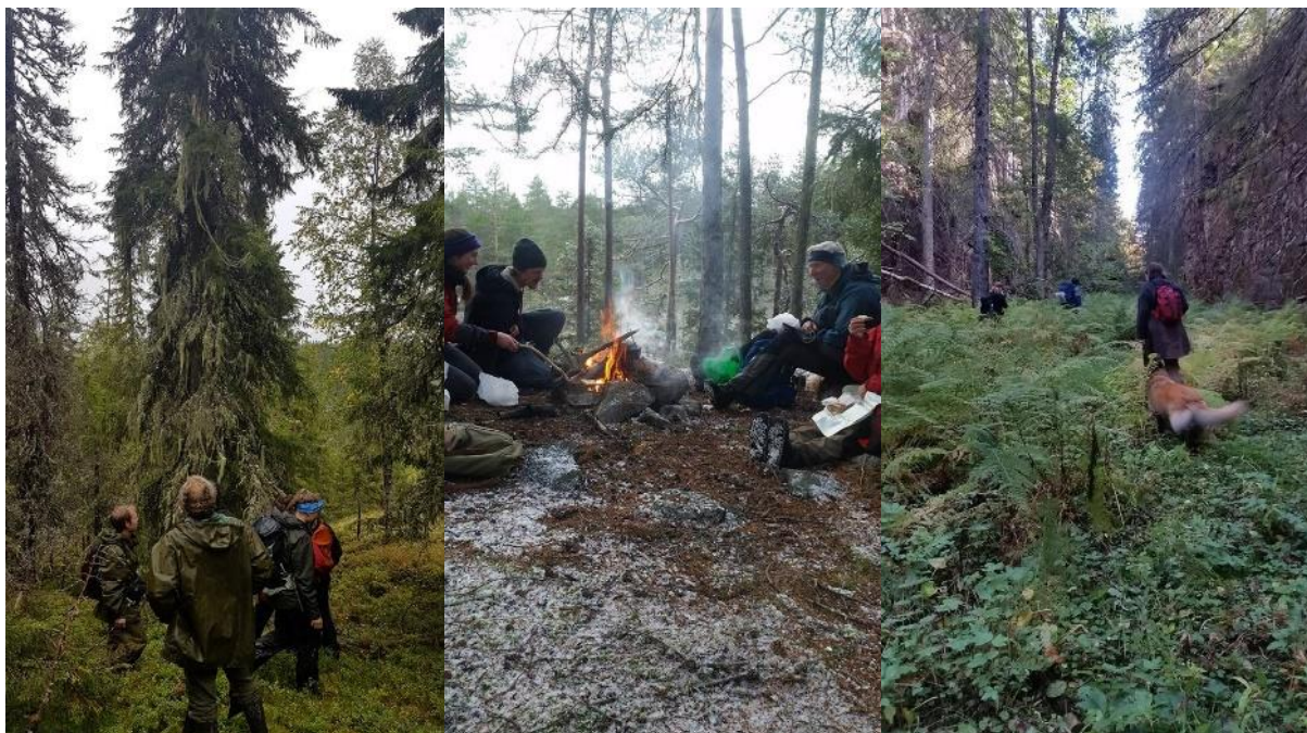
Fra Registreringskursene høsten 2018

For at deltagerne skulle få repetert den ervervede artskunnskapen dro vi ut på registreringsturer de aller fleste helgene utover høsten. Takket være den stadig voksende Facebookgruppen «Redd gammelskogen» hvor vi oppfordret alle medlemmer til å bli med, var det stadig nye ansikter som ble med på tur. Vi håper å fortsette dette arbeidet den kommende høsten.