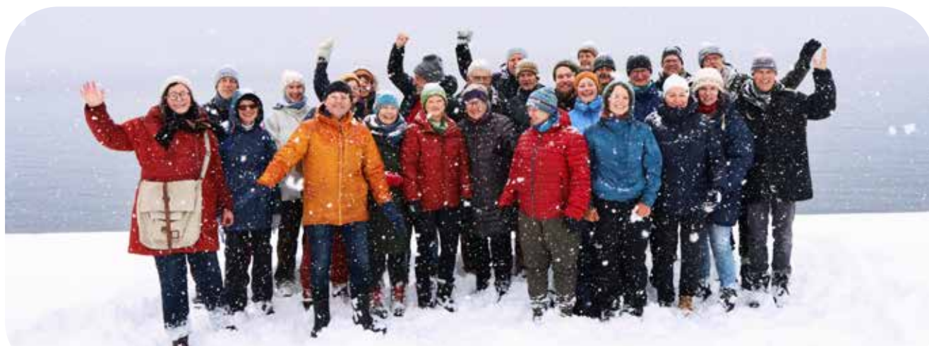
Naturvernforbundets landsstyre i Vevring ved Førdefjorden høsten 2023.

Saken er anket - så siste ord er ikke sagt.