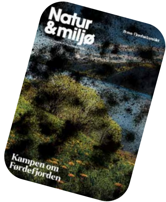
Forsidedesign: Eivind Stoud Platou

Natur & miljø er medlem av Fagpressen, og hadde i 2022 et godkjent opplag på 28 837. Før magasin 1-2023 ble det byttet trykkeri - magasinet trykkes nå hos Ålgård Offset, etter en avtale via Fagpressen.