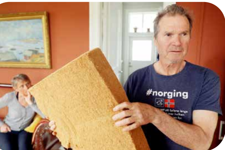
Etterisolering med trefiber.

Strømstøtte til husholdninger kostet godt over 30 milliarder kroner i 2022, og nesten 10 milliarder i 2023. Dette er veldig mye mer enn det som brukes på