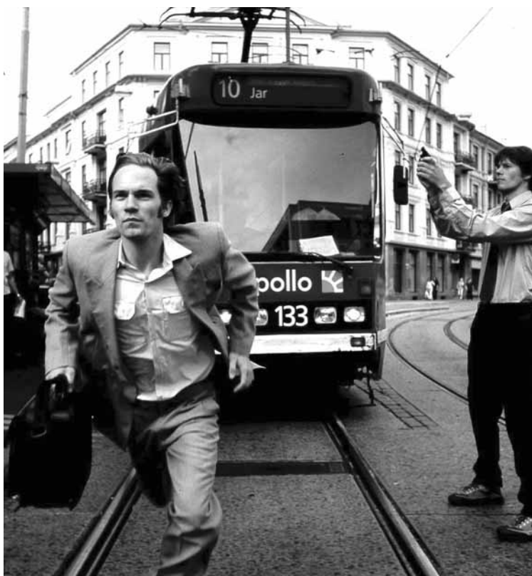
Trikkeaksjonen: Fra Naturvernforbundet og Oslo Byaksjon sitt kappløp med trikken 18.august.