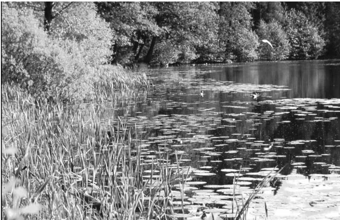
Tjersrudtjern, et av Bærums næringsrike og artsrike tjern, under langsom gjengroing.

I Bærumsmarka, Vestmarka og deler av Krokskogen ligger tyngden av Bærums arealer. Disse skogsområdene er en del av den såkalte Oslo-marka, de store skogsområdene nord for Oslofjorden. For slike bynære skoger har det lenge vært pekt på behovet for en spesiell forvaltning. Skogbrukshensyn bør ikke være enerådende her. Det må ikke bare dreie seg om økonomisk avkastning. I 1973 fremmet Helge Seip