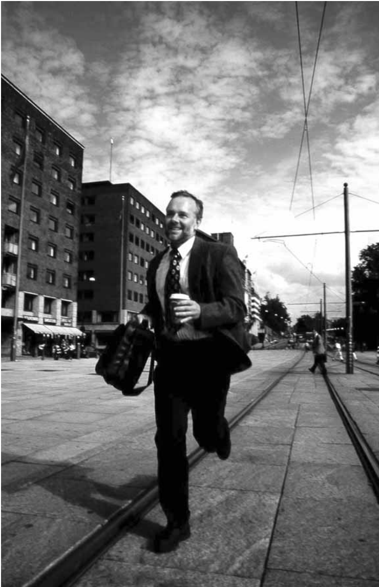
Trikkeaksjonen: Fra Naturvernforbundet og Oslo Byaksjon sitt kappløp med trikken 18.august.