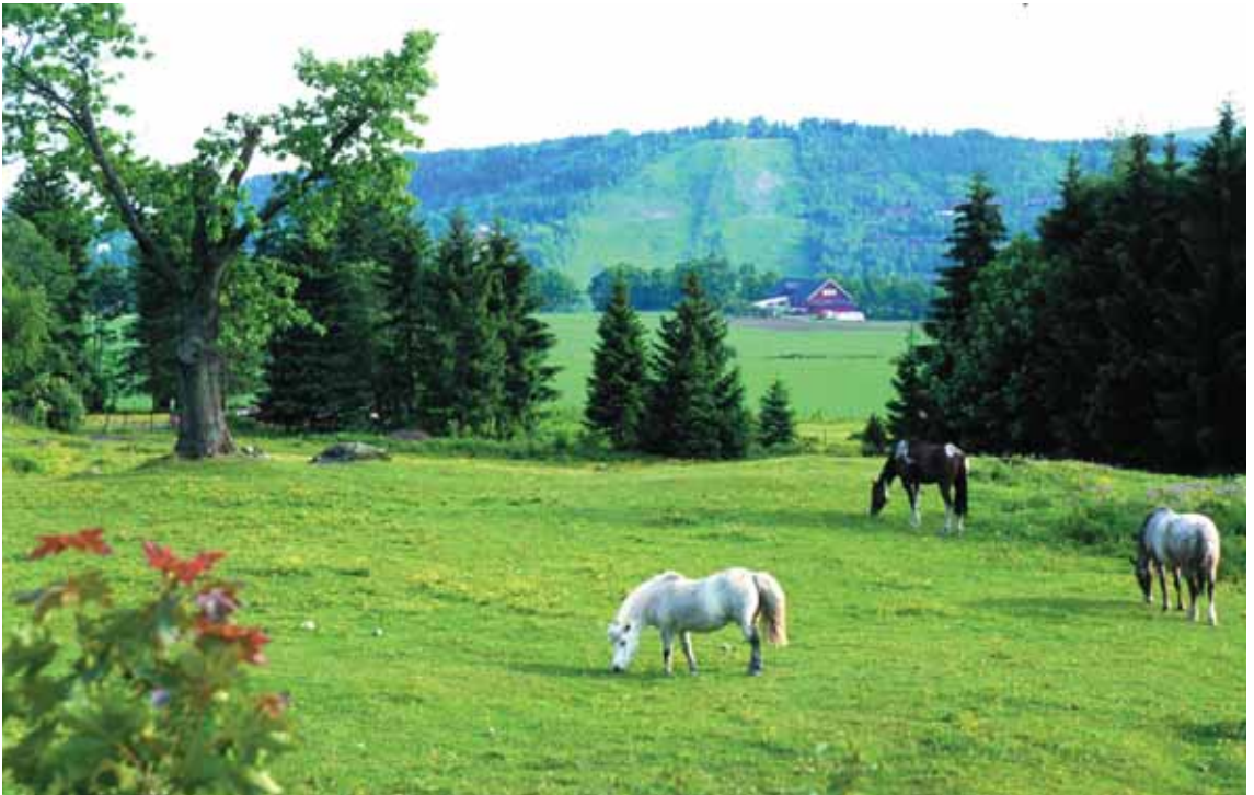
Hestehagen på Bryn er til meget stor glede for Rykkinn's befolkning.

Men kommunen må også gies honnør for sin innsats både for naturvern og friluftsliv. Det er opprettet en