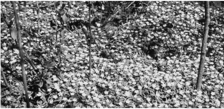
Gulveisforekomst i edelløvskog langs Isielva.