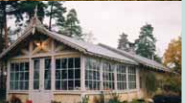
Seterhytten på Dronningberget.