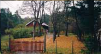
Skogvokterboligen i Kongeskogen.