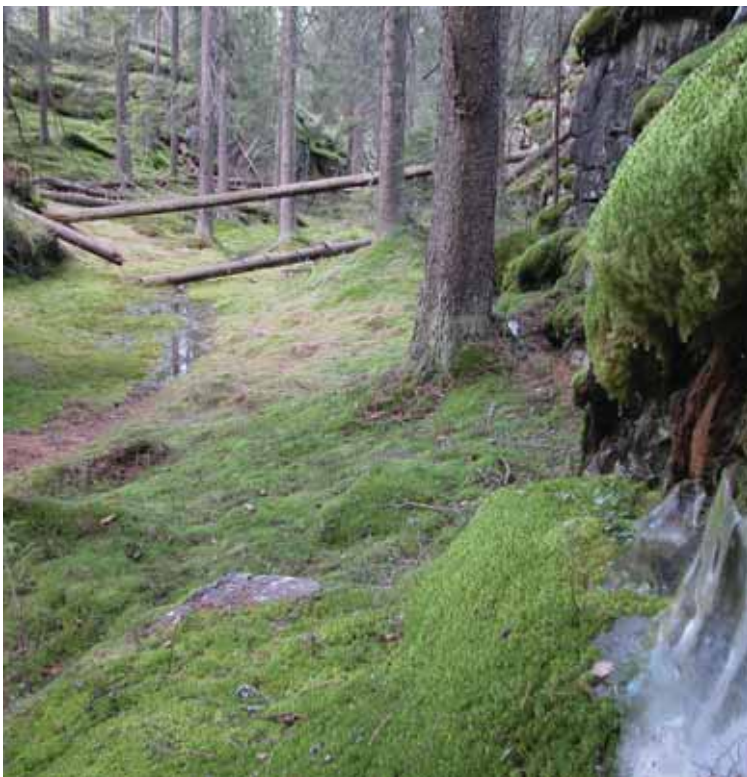
Parti fra Lusevasan.

Det er godkjent en hogstplan for området, som vil medføre at den gamle skogen vil bli hugget i løpet av kommende 10-års-periode. NOA har klaget godkjenningen inn for Fylkesmannen, og anmodet grunneieren om enten å tilby området til "frivillig vern" eller starte diskusjon med Nittedal kommune om makeskifte med kommuneskogene. Grevlingen kommer tilbake med mer informasjon i neste nummer. Følg også med på NOAs nettside www.noa.no