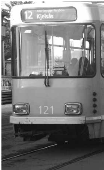
Kjelsåstrikken på skinnene igjen.

I september 2003 ga Samferdselsministeren Statens vegvesen i oppdrag å redusere reisetiden for kollektivtrafikken i Oslo-området med 20 prosent Statens vegvesen satte i gang et pilotprosjekt på de fem kollektivlinjene