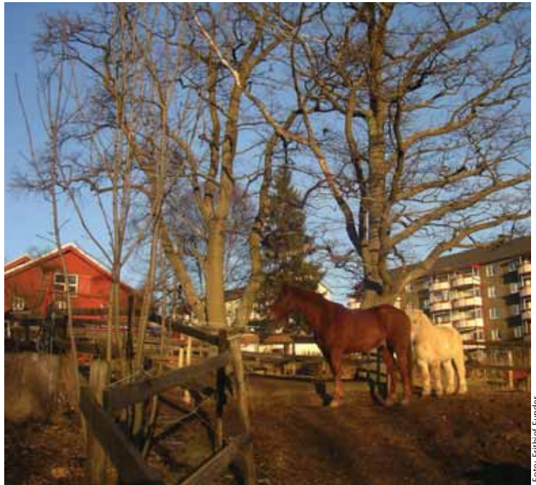
Eikene på Årvoll gård.

- Opplevelse av trær gir bedret helse. Vitenskapelige undersøkelser viser at syke mennesker