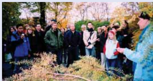
Fra Naturvernforbundets folkemøte på Torshovtoppen 24.10.04.

Vi avslutter med kaffe og kaker på Vøienvolden gård.