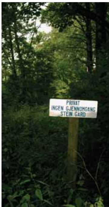
Skilt midt på Ankerveien

Veien har nå vært stengt i ca. 40 år. Den nåværende eier kan ikke påberope seg å ha blitt eier etter reglene om hevd, fordi familien ikke har vært i god tro. De har jo søkt om å få eiendomsretten, men har ikke fått