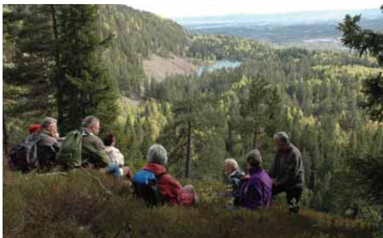
Utsikt til Strømsdammen og Rødkleiva. Bildet er tatt i forbindelse med etableringen av lokallaget Oslo Vest.