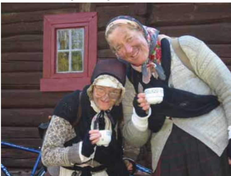
Søstrene på Værket i kjent stil.

En ting er sikkert: Å dele en historisk teatervandring gir fantasien vinger! Og hvem vet, kanskje tørsten etter mer kunnskap også blir større?