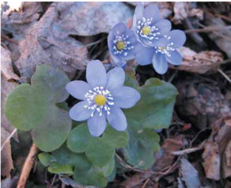
Blåveisen liker kalkrik jord.

effekt langt ut over den aktuelle turen. Verdsetter de først det å være ute i naturen, vil de være mer fysisk aktive senere i livet. I tillegg til skoler blir det allerede utarbeidete kartet verdsatt av turgåere i området. De er overasket over hvor stort mangfold som finnes selv på små arealer. Naturglede og inspirasjon til fysisk aktivitet når altså fram til flere grupper. Vi ønsker å benytte anledningen til å takke alle som har bidratt, både med arbeid og med finansiering av prosjektet.