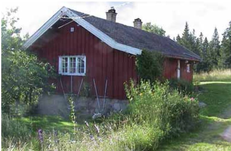
Frønsvollenstua sett fra sydøst.