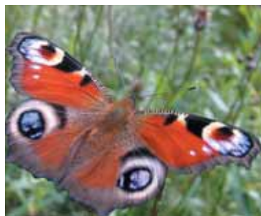
Dagpåfugløyve lever særlig i områder der det vokser tistler!