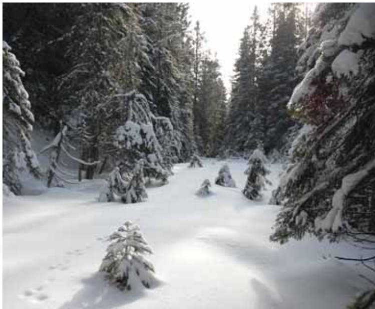
Kanskje den snørikeste åsen i Nordmarka?