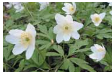
Blomstrer hvitveisen er det tegn på at saueene kan slippes på beite.

tet til hver av postene. Stort sett er dette planter som gjør det lettere å kjenne igjen akkurat denne typen skog. Vegetasjonskartet kan fortelle deg hvor du finner blåbær, for eksempel!