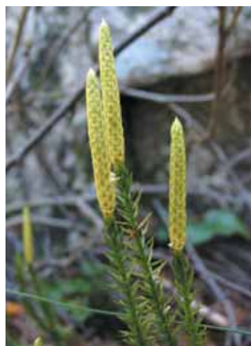
Fra stri kråkefot får vi heksemel som er naturens eget fyrverkeri!

Heftene starter med litt generell informasjon om biologisk mangfold og vegetasjonstyper. Biologi-postene følger de ulike typene vegetasjon. Det er også bilder og tekster av planter knyt-