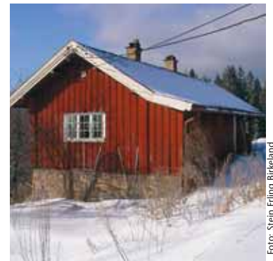
Frønsvollen i vinterdrakt.