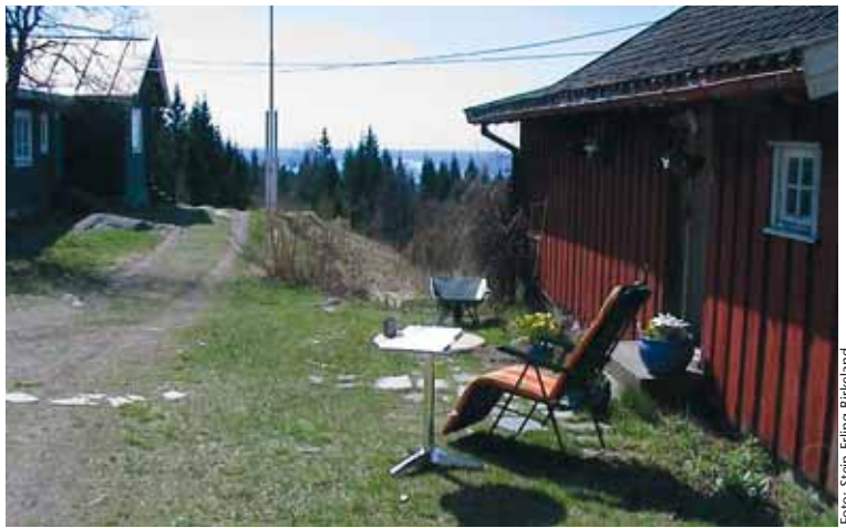
Utsikten sørover fra Frønsvollen.

stedets tilknytning til det enkle friluftsliv. Frønsvollen ligger midt i et eldorado av stier fra Frognerseteren stasjon til kjente markanavn som for eksempel Tryvannstua, Skjennungstua og Ullevålseter. Her har turgåere passert i uminnelige tider og nå skal vi i tillegg gi dem en ekstra opplevelse.