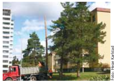
Trefelling på Oppsal.

Det tar femten minutter å kappe ned et tre – det tar 150 til 200 år før et nytt har vokst seg stort. Trærne er en del av menneskers historie og minner. Trærne blir eldre enn oss, de er en del av vår historie og identitet.