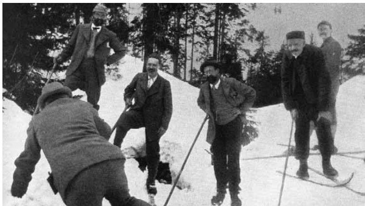
Frønsvollkara på tur.