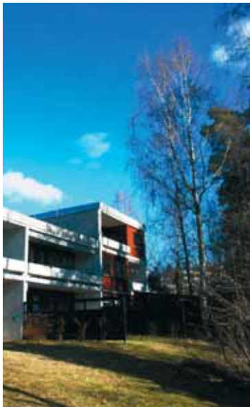
De to bjerkene er nå desverre felt.

NOA har gjort dette til en prinsipp sak. Kommunen har gjort et forvaltningsvedtak – trærne kan fjernes etter henvendelse fra borettslaget. Byøkologisk program slår fast at byens blågrønne preg skal bevares, dermed kan ikke saksbehandlere etter vår mening fatte denne type vedtak etter eget for godt-befinnende. I dag finnes det ikke kriterier for felling av trær. Vi har pålagt kommunens vedtak i denne saken og ba om oppsettende virkning. Vi vil vite nøyaktig hvilke kriterier kommunen legger til grunn for fellingstillatelse av denne typen. Kommunale vedtak av denne typen skaper presedens. Etter dette skal det bli vanskelig å nekte andre borettslag fellingstillatelse. Dermed starter man en redusering av dette flotte skogområdet.