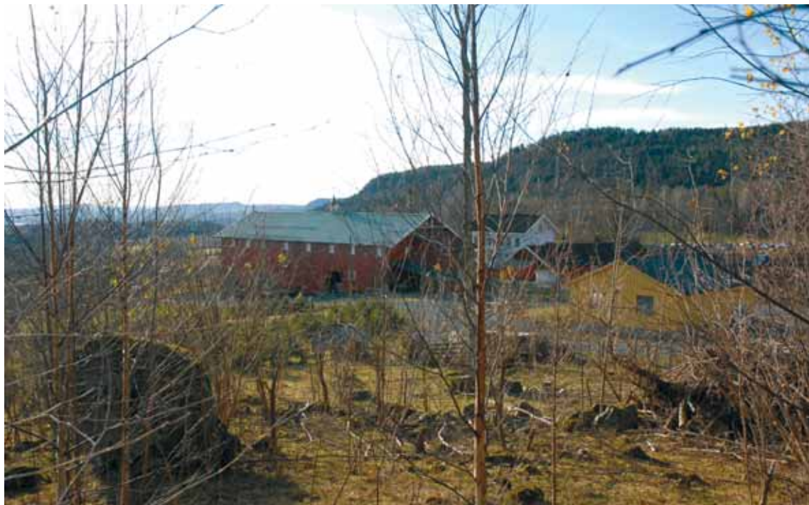
Stein gård med Kolsås-Dælivann Landskapsvernområde i bakgrunn.

mel for å nekte ferdsel langs Ankerveien, heller ikke gjennom Stein gård. (se Grevlingen 3/05 s 12 og 1/07 s 11). Jeg velger å referere hovedpunktene i hans argumentasjon hvor det går tydelig fram at grunneieren ikke har eiendomsrett til veien: "I 1957 skrev grunneieren til Bærum kommune og ba om å få eiendomsrett til den delen av veien som går gjennom tunet hans (Stein gård). Kommunen sendte saken til fylkesstyret med sin anbefaling, men ingen, verken kommunen eller eieren kan se å ha fått noe svar. Da han ikke fikk noe svar, stengte han veien med grind og hengelås, og tvang allmennheten ned en nesten ufarbar skråning til riksveien, på et trafikkfarlig sted."