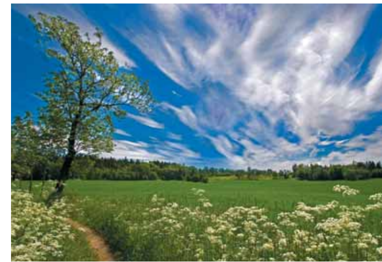
Utsikt fra turstien ved Butterud gård og mot Tanum kirke.

Den naturlige vegetasjonen er typisk for kambrosilur-bygdene vest for Oslo, men det er særlig vegetasjonen knyttet til restene av det tidligere jordbrukslandskapet som gjør området spesielt. Dyrelivet speiler tilgangen på næring og andre livsbetingelser. Den meget varierte strukturen, med veksling mellom jorder, skog, beitemark og med rike innslag av alléer, gamle styvingstrær