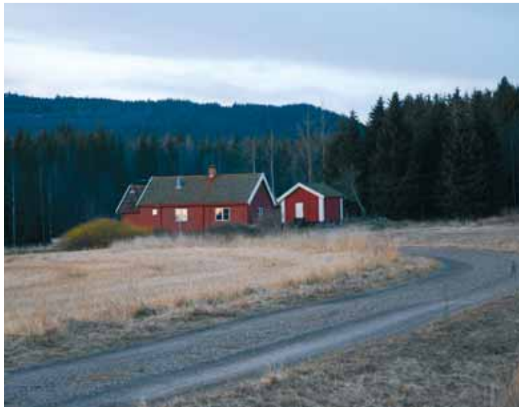
Plassen Vestby nordvest for Brenners i Maridalen.

Skal vi ta vare på artsmangfoldet kulturlandskapet kan vi nesten glemme områdene med industrijordbruk, og konsentrere oss om å opprettholde restene av småskalalandskapet og skjøtte disse på måter som etterlikner det gamle jordbruket. En slik drift er ikke lønnsom for den enkelte bonde, men burde være næringens og samfunnets felles ansvar. Skal vi opprettholde mangfoldet, kunne det kanskje være en god idé å styre tilskuddsmidlene bort fra produksjonen i industrilandskapet, og over til vedlikehold av de mest verdifulle områdene. Det finnes eksempler på idealister som utfører slikt arbeid, rundt i hele landet, men det er helt utilstrekkelig. Situasjonen skriker etter offentlig styring og ressurser. Styggrike Norge burde ha råd til å ta vare på naturmangfoldet og naturarven for framtida, både i kulturlandskapet og i skoglandskapet rundt.