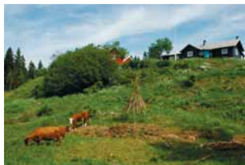
Sommer med beitedyr på Frønsvollen.

Prioriteringer for 2008 er økt innsats for hagebruk og dyrking, ytterligere rydding av beitemarken, overnattingsmuligheter på låven – og ikke minst rekruttering av flere entusiaster til arbeid og dugnad!