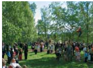
Birkelunden. Finnes det en flottere møteplass for festkledde mennesker på 17. mai? Svært viktig grønn lunge i Østre Bærum som er fattig på grøntarealer.

grønne lungene som opptok oss. Et stadig ønske om mer plass til hus, veier, barnehager og annen