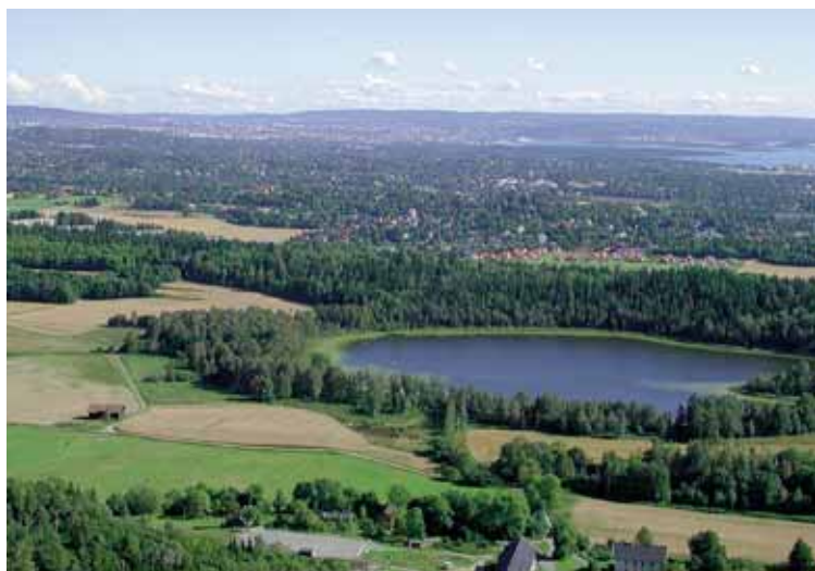
Utsikten fra Kolsås mot Østre Bærum og byen. Dælivannet i forgrunnen.

Stiftelsen av Bærum Natur- og Friluftsråd er et stort skritt i riktig retning. Vi har grunn til å glede oss over denne milepælen!