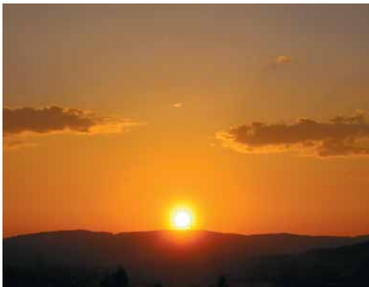
Sola over Tryvannsåsen får være symbolet på tro på livgivende krefter.

Personlig har jeg også et ønske om sterkere regional styring av