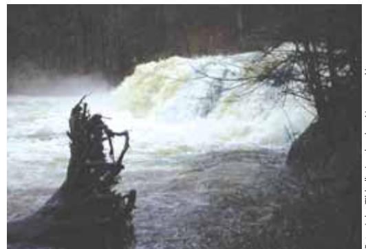
Slik kan Storengfossen arte seg, men bare i en femårsflom!

Sørkedalselva og Lysakerelva som flere ganger i løpet av en vinter går fra å være nærmest uttørket til å gå flomdiger vil ikke tåle et så stort vannuttak. Det er når det er kuldegrader og elva er på det laveste at man trenger vann til snøkanonene. Videre vil det føre til usikker is på Bogstadvannet, Øvresertjern og Skomakertjern.