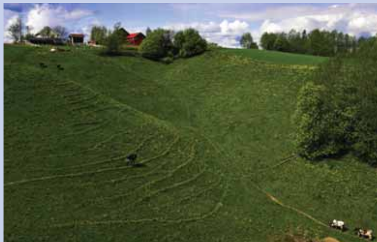
Edelløvs skogen nede i ravinlandskapet er omgitt av åpne beitemarker.