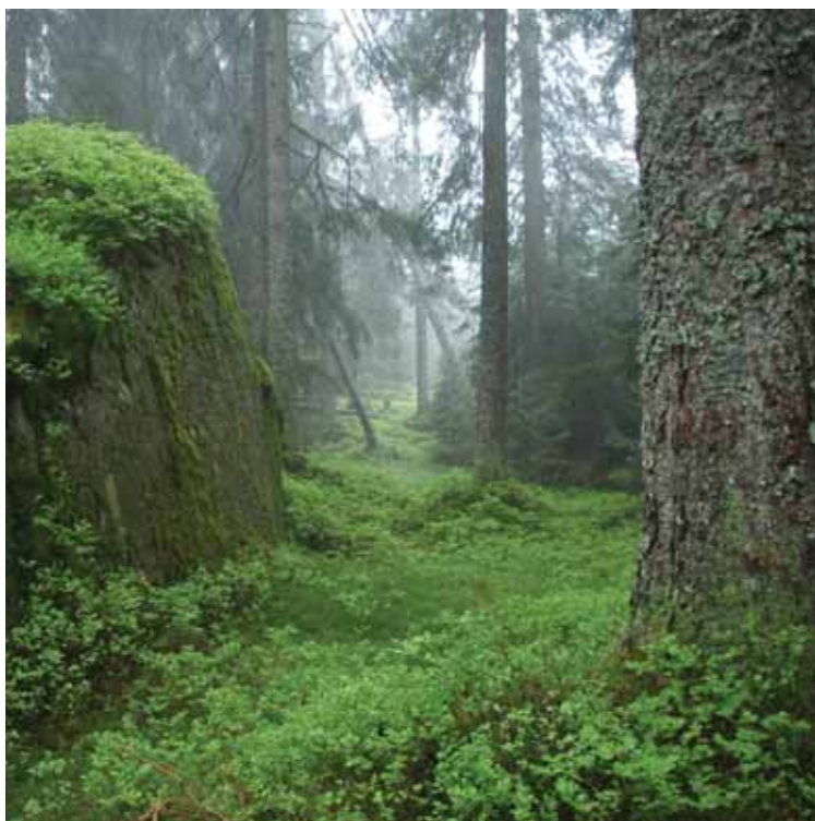
Gammelskogen slik vi vil ha den!