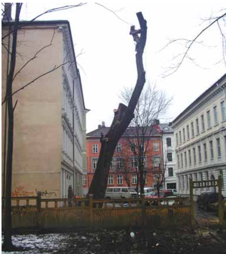
En gammel kjempe felles i Gamlebyen.