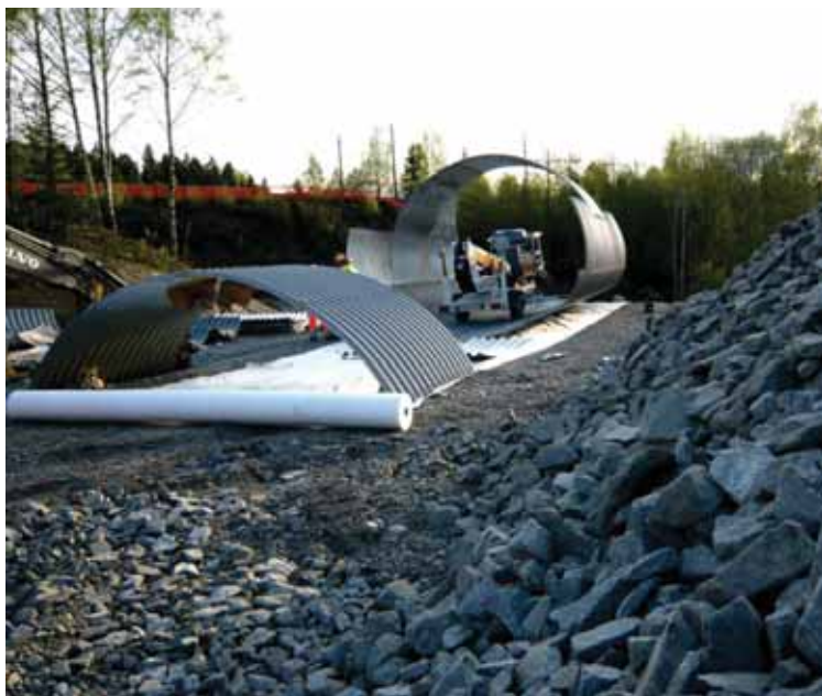
Bare få dager etter var disse rørene på plass!

naturligvis åpen elv og turveipassasje forbi Godsterminalen fra Nedre Kalbakkvei til Alnabru. Planene er der og også viljen ganske høyt opp i systemet. Og ikke bare det – muligheten for en turveipassasje langs elveløpet under jernbanen fra Fagerlia nedenfor Bryn til Svartdalsparken er også klarlagt. Ikke dårlig. Men det skjer noe andre steder også; Oslo og Bærum kommuner prosjekterer nå sammen et gjennomslag i Jarfyllinga, steinfyllingsbroen som fører Bærumsvveien, Jartrikken og t-banen over Lysakerelva! (Denne redaktør og Lysakerelvas Venner har vært med på en håndfull befaringer bare dette året.) Det vil si at vi kan få en sammenhengende turvei langs hele Lysakerelva fra Sollerud til Bogstad uten å måtte gå høyt oppom Vollsveien på Jarsiden