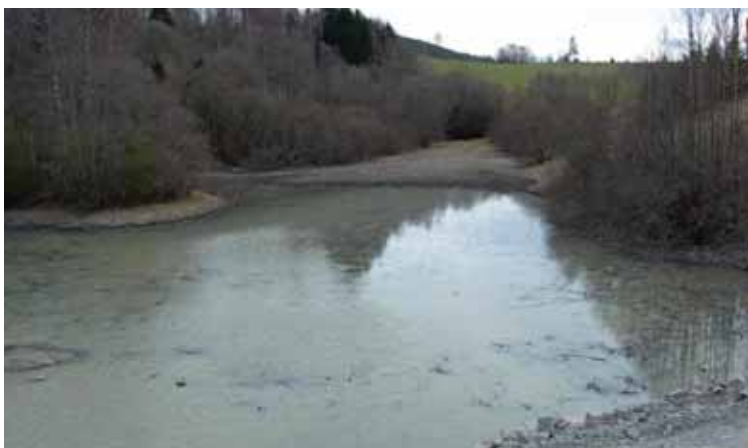
Her er Stintevja.

Vi argumenterte for bedret kollektivtrafikk og la spesielt vekt på bedre togforbindelse ved å bruke Oslopakke-midlene på NSB og Jernbaneverket. Sammen med lo-