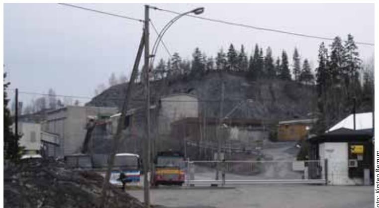
Oslo Vei vil sprengre seg innover i Lillomarka!

Da markaloven var oppe i bystyret ifjor foreslo byrådsavdeling for miljø og samferdsel i sin høringsuttalelse å justere markagrensa i forhold til Huken. Også dette viser hvor ivrig byrådet er på å få utvidelsesplanene i boks. Men dette forslaget ble heldigvis nedstemt. Da ble det dessuten vedtatt at store deler av utvidelsesområdet skal vernes med henblikk på friluftsliv! Hukenområdet ligger i sin helhet innenfor dagens markagrense. Det var nettopp hensynet til friluftsinnteressene som i 1973 lå bak miljøverndepartementets begrunnelse for å forhindre ytterligere utvidelse av Huken pukk- og asfaltverk. Dette er ikke mindre aktuelt idag! Man skulle derfor tro at 100-meterskogen vår og inngangsporten til Lillomarka nå var reddet. Likevel er dette fremdeles en "ikkesak" i media utenfor lokalpressen, og så vidt vi vet har verken Ap, Høyre eller KrF tatt endelig standpunkt mot utvidelse/for avvikling av pukkverket. Dette betyr at kampen vår ennå ikke er vunnet. Derfor er det fremdeles nødvendig med støtte fra alle natur- og friluftsganisasjoner.