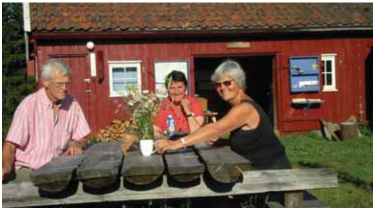
Tre glade mennesker på tunet med stallen i bakgrunnen.

Noter helgene 13.-14. september og 25.-26. oktober som dugnadsdager på Frønsvollen.